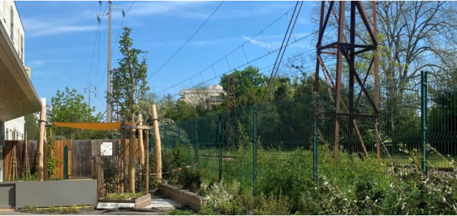
Les bacs potagers et la bande texturée