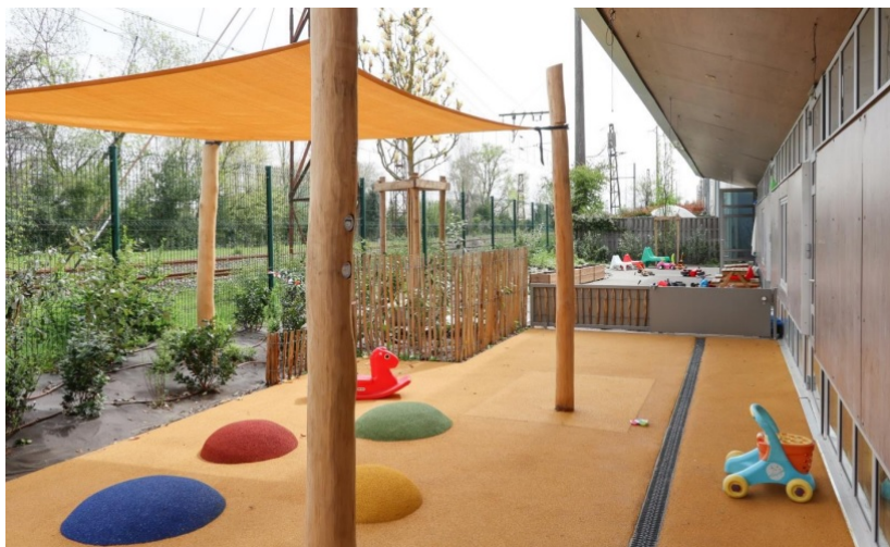
Vue de la cour (côté des plus petits)