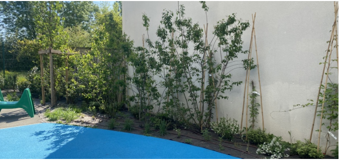
Le trampoline et les plantes grimpantes