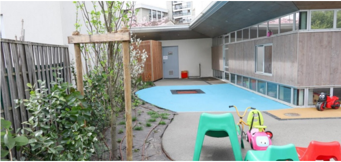
Vue depuis le massif récemment planté