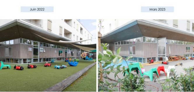
La cour de la crèche avant-après travaux