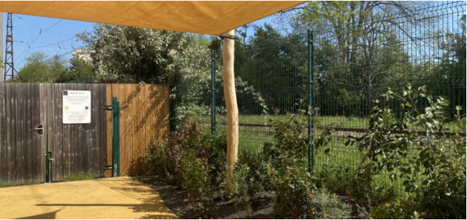
La pergola et les bosses colorées