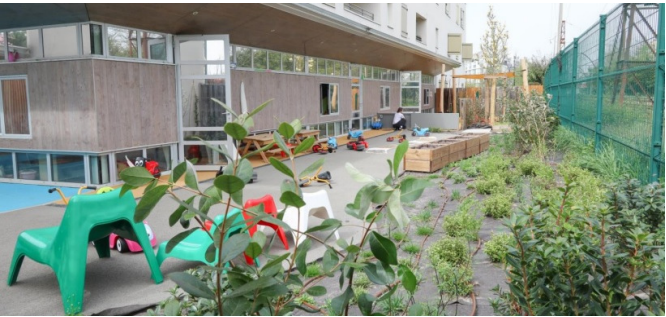
Vue depuis le massif récemment planté