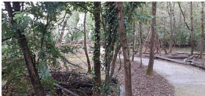
Une cour ou plutôt un chemin dans la forêt ?