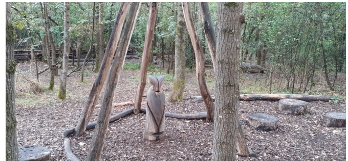
Un hibou caché dans son tipi