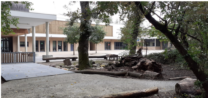
La forêt est venue "coloniser" les cours du Groupe Scolaire G. Mailhos