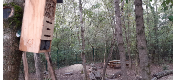
Une cabane pour les insectes qui peuvent regarder les cabanes et jeux des enfants