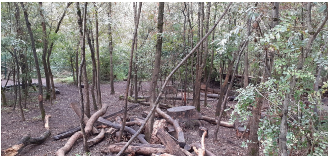
Il s'agit bien d'une forêt