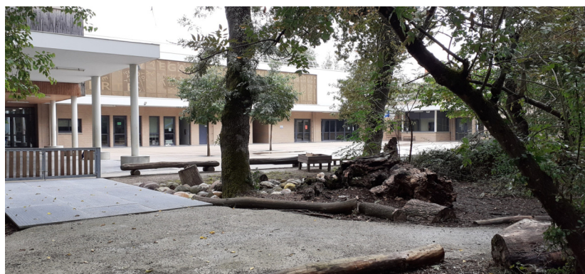
La forêt est venue "coloniser" les cours du Groupe Scolaire G. Mailhos