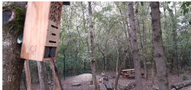
Une cabane pour les insectes qui peuvent regarder les cabanes et jeux des enfants