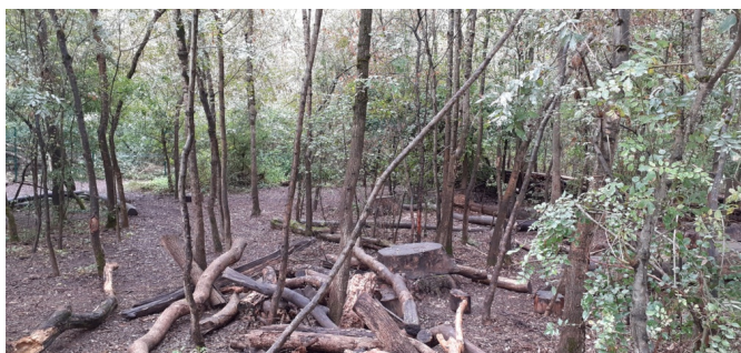
Il s'agit bien d'une forêt