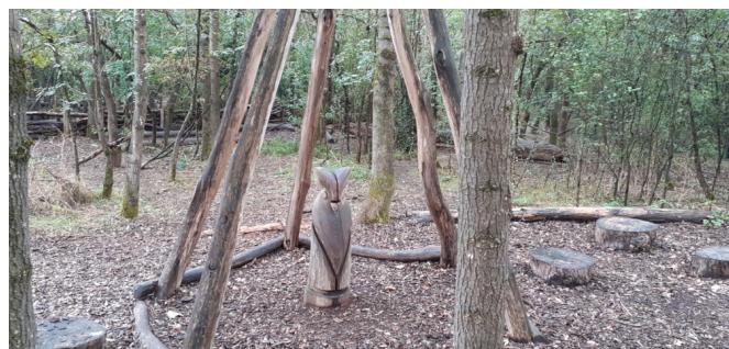
Un hibou caché dans son tipi