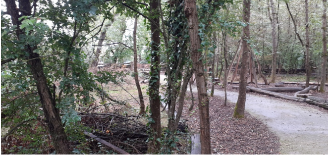
Une cour ou plutôt un chemin dans la forêt ?