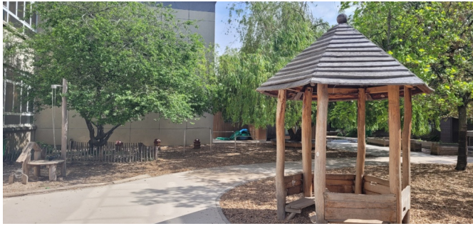
Le kiosque en maternelle