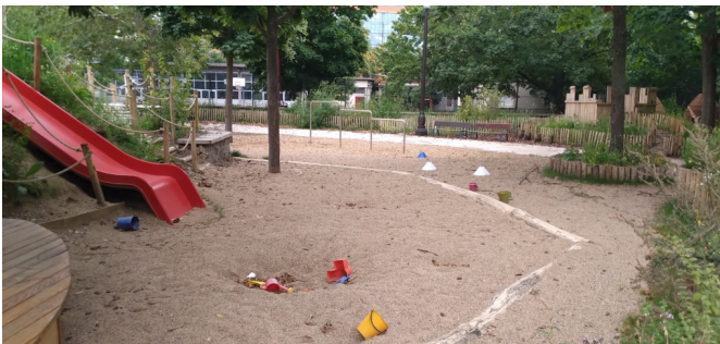
Zone de sable en élémentaire