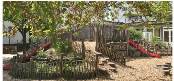
Le relief côté maternelle