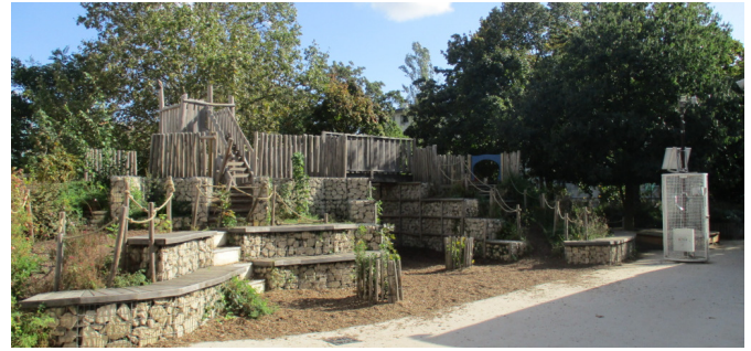
Le relief de la cour élémentaire | © CAUE de Paris