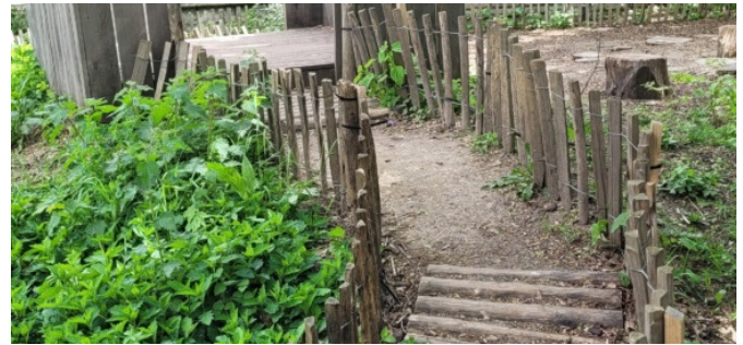
Petit chemin à travers la végétation en élémentaire