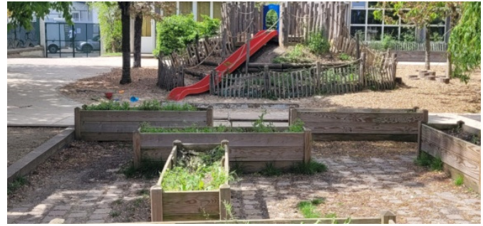
Le jardin potager des maternelles