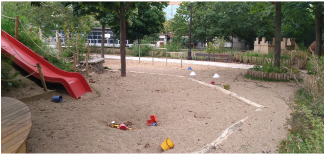
Zone de sable en élémentaire