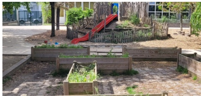
Le jardin potager des maternelles | © CAUE de Paris