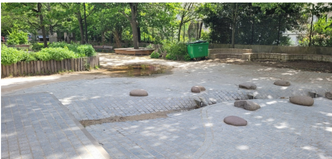
La rivière qui passe entre les deux écoles