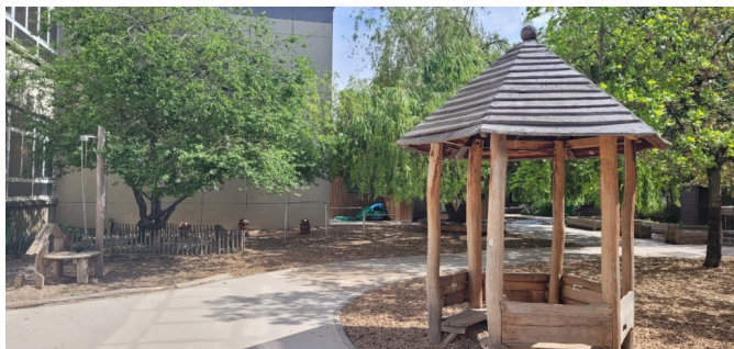
Le kiosque en maternelle