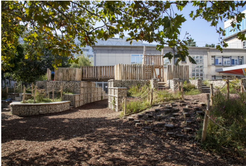
Butte végétalisée