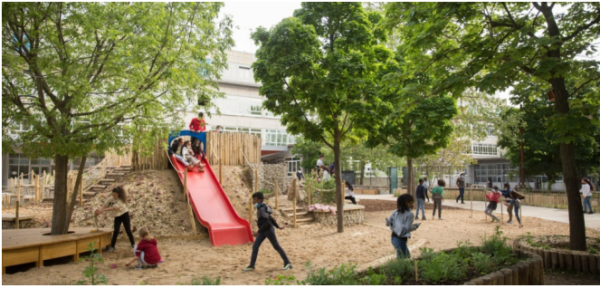
Toboggan et sable à l'école élémentaire