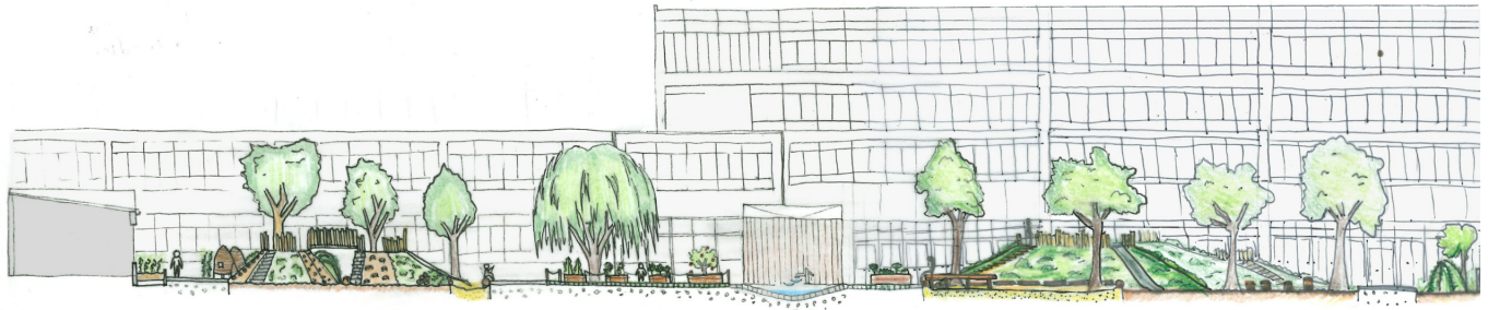
Coupe illustrée du projet | © CAUE de Paris