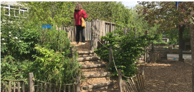
Les buttes plantées côté maternelle