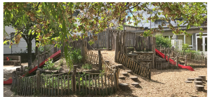
Le relief côté maternelle