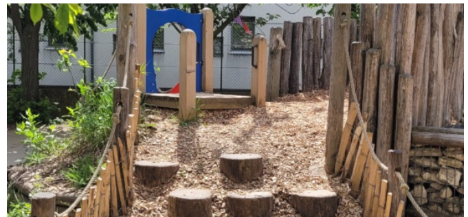
La montée en rondins de bois debout