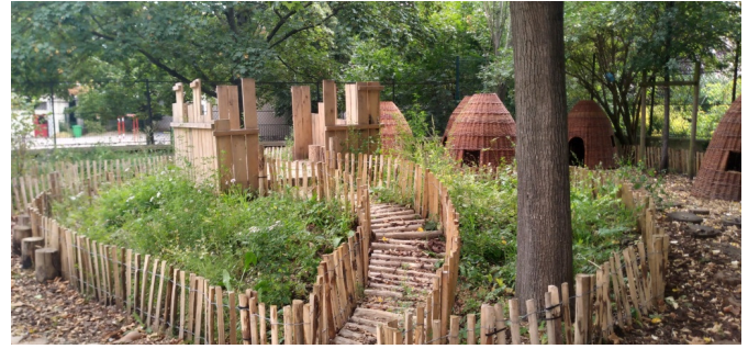
Zone naturelle, plantations et ganivelles