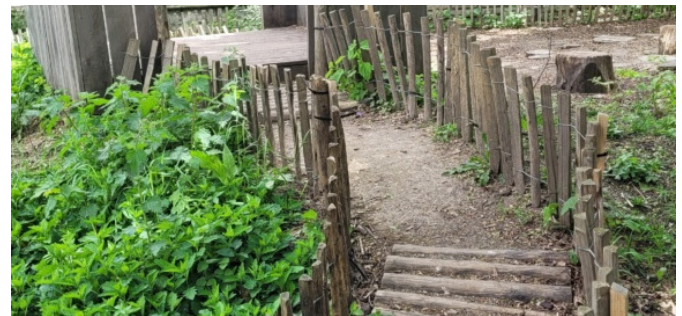
Petit chemin à travers la végétation en élémentaire