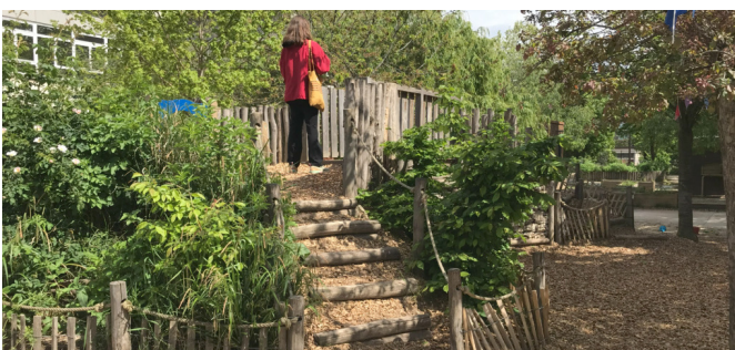
Les buttes plantées côté maternelle