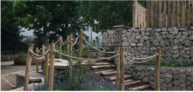
Butte en gabions, banc et plantations