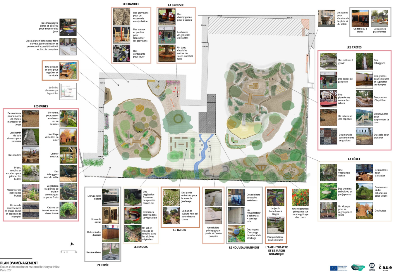
Plan illustré des écoles Maryse Hilsz | © CAUE de Paris