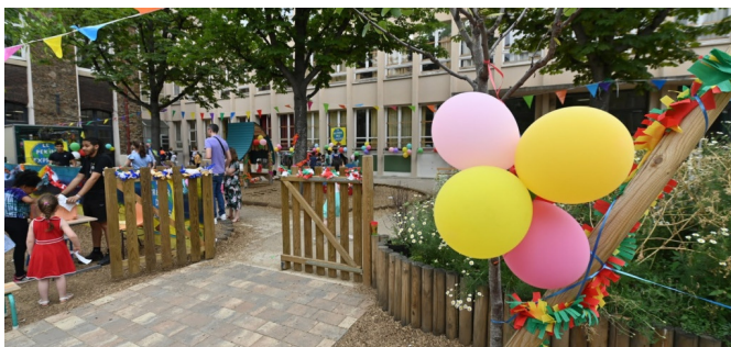
Un portillon permet le passage occasionnel d'une cour à l'autre