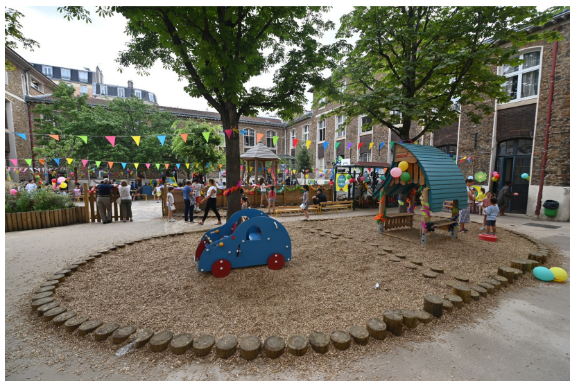
| © Ville de Paris - Laurent Bourgogne