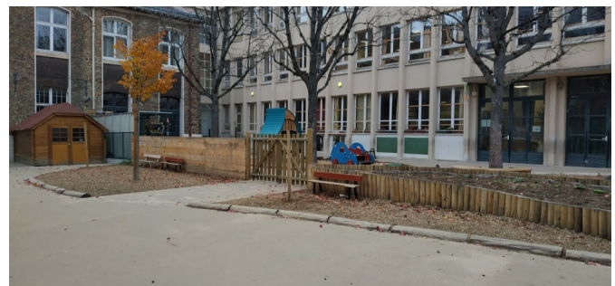
Traitement de la limite entre l'élémentaire et la maternelle - à droite, jardinière pédagogique avant plantation par les enfants de chaque côté