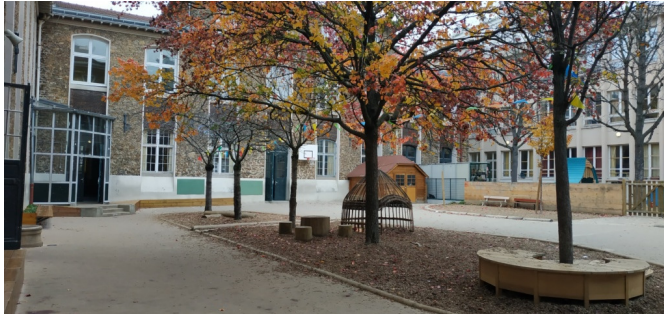
Cour 1 de l'élémentaire - zone perméable centrale avec assises, cabane et grumes au pied des fruitiers