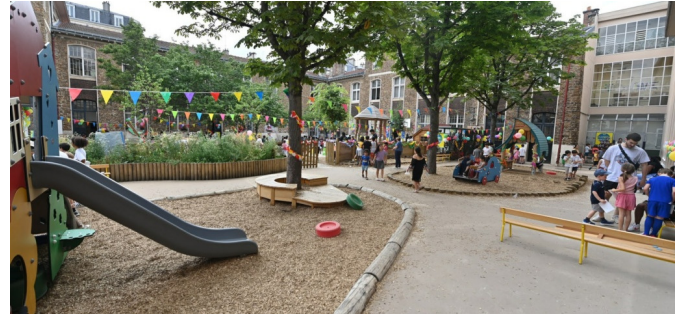
Cour de maternelle - structures de jeux existantes conservées et intégrées aux nouvelles zones perméables en copeaux