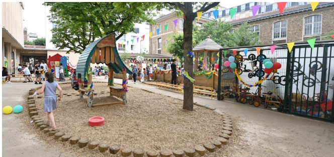
Cour de maternelle - Cabane en bois dans la zone de copeaux centrale et asphalte en périphérie pour la circulation des vélos