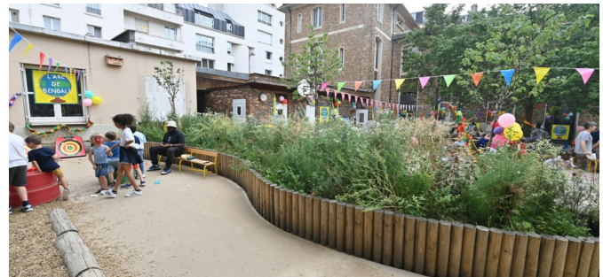
Jardinière plantée entre les deux cours