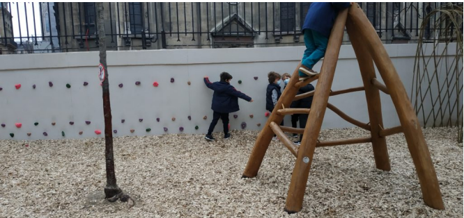
Espace d'escalade côté élémentaires