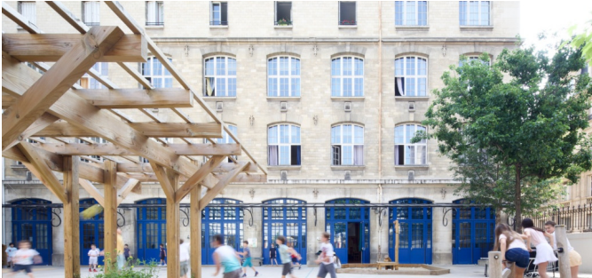
Vue depuis le côté des élémentaires