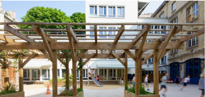
Pergola | © Théo Ménivard/ CAUE de Paris