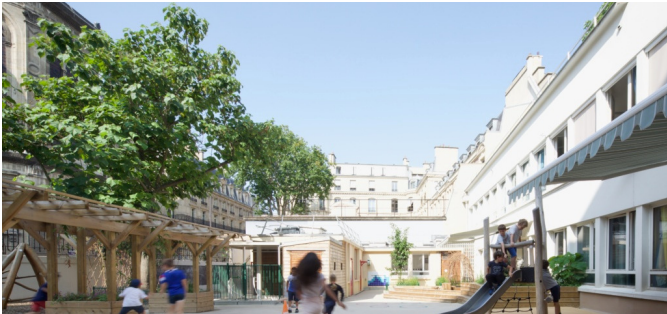
Espace au dessus du réfectoire | © Théo Ménivard/ CAUE de Paris