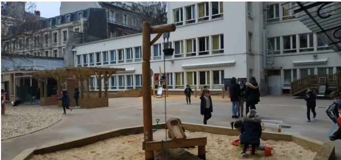
Bac à sable et poulie de jeu | © CAUE de Paris