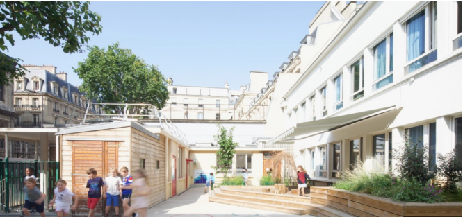
Zone de copeaux des maternelles sur dalle, surélevée pour drainer l'eau vers la zone plantée en contrebas