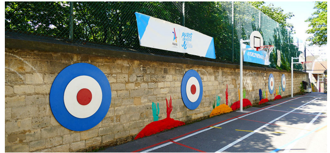
Cibles et fosses avec plantes grimpantes au 14 Riblette