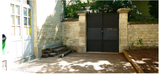
Estrade en bois, banc mikado et tableau à craie au 16 Riblette