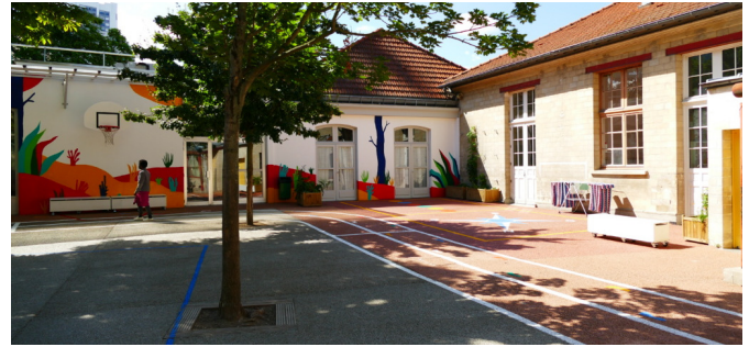
Cour du 12 Riblette