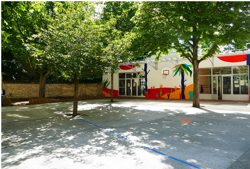
Cour de l'école 16 Riblette

École élémentaire 20e arrondissement 2018