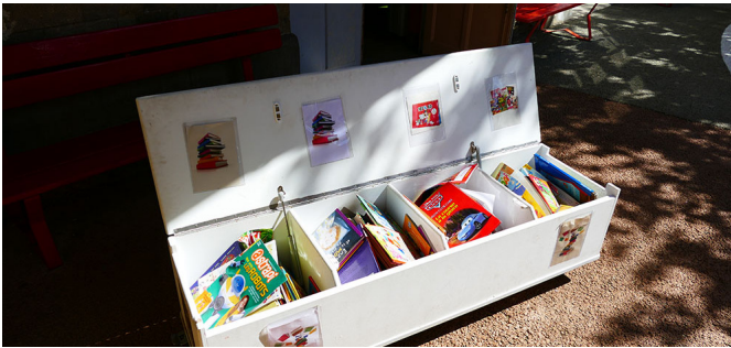
Banc coffre