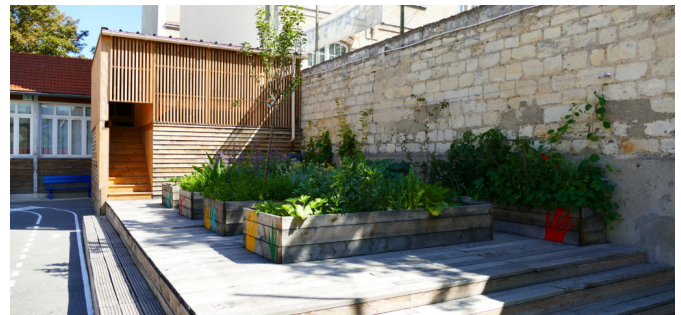
Terrasse de jardinage au 12 Riblette