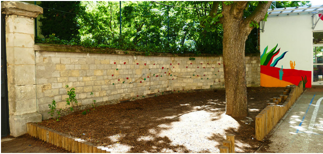
Zone de copeaux avec via ferrata au 16 Riblette