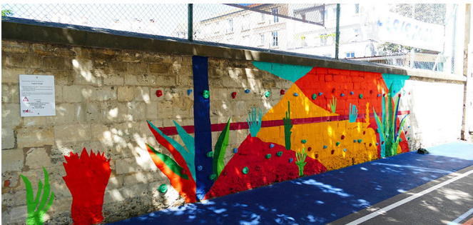
Fresque et mur d'escalade au 14 Riblette