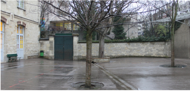
La cour avant les travaux