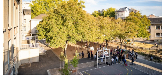
La cour élémentaire