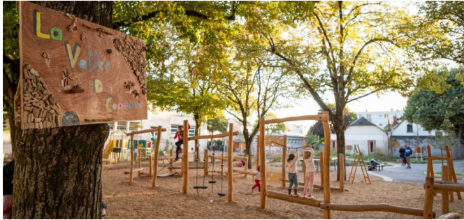
Grande zone en copeaux avec parcours d'équilibre en bois