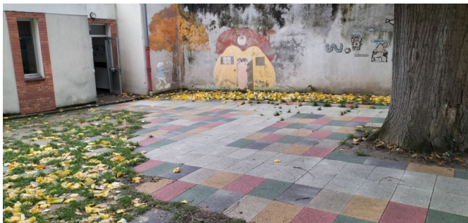
Dalles perméables multicolores dans la cour élémentaire