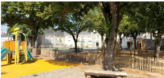
Banc en bois "fait maison" dans la cour maternelle