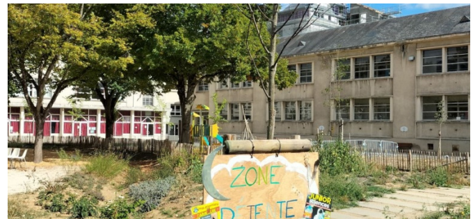
Les enfants se sont approprié leur cour en installant des panneaux et en définissant les nouvelles règles de la cour