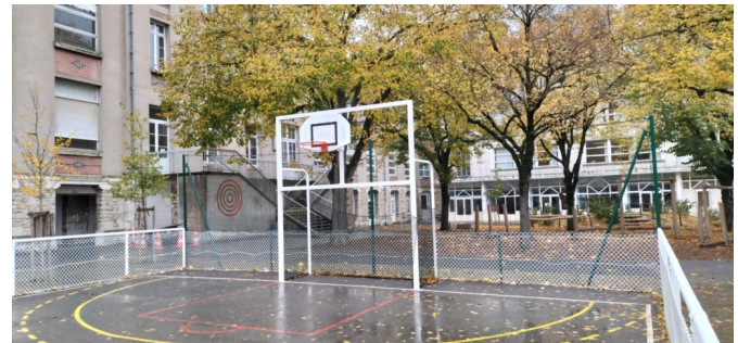
Le terrain sportif avec combis et filets pare-balle