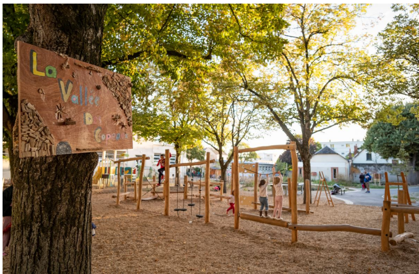
Cour de l'école Buisson-Molière