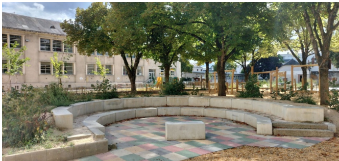
Amphithéâtre de la cour élémentaire