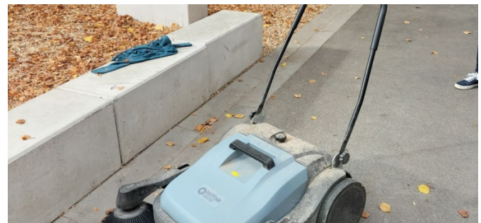
"La machine à ramasser les copeaux" (balayeuse mécanique manuelle ou floorboy)