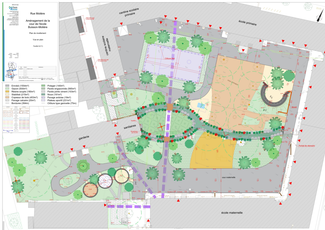
Plan du projet pour l'école Buisson-Molière