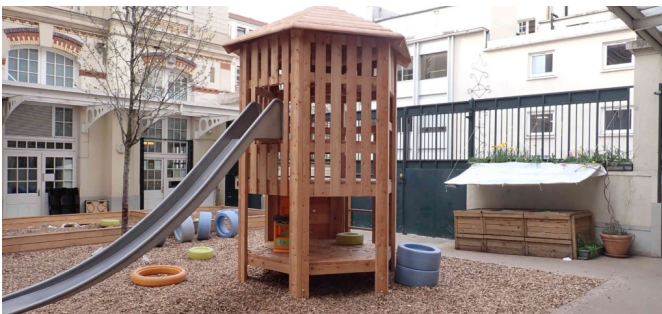
La grande structure et le compost existant qui a été déplacé.