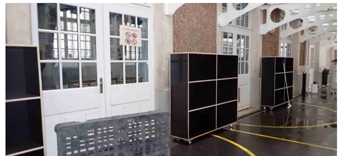
Armoires mises en places pour ranger les cartables qui envahissaient les couloirs et les circulations de l'école