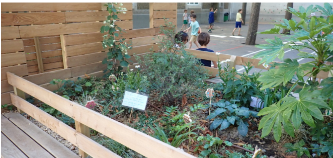
Les plantations ont été complétées par les enfants qui ont également réalisés une signalétique