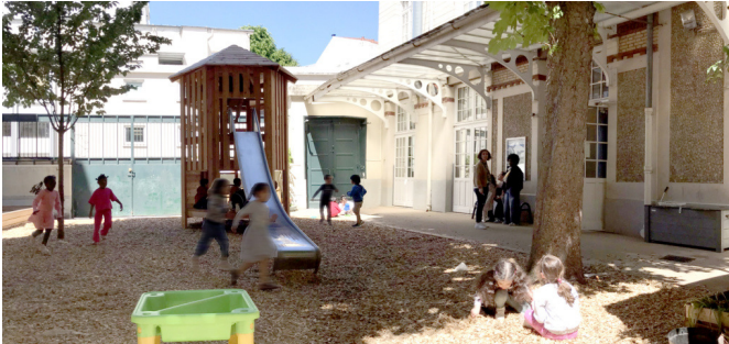
L'espace naturel et ludique avec le sol en copeaux et la grande structure de jeu