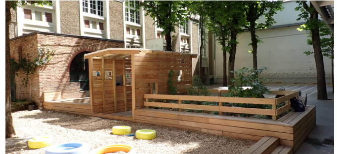
La transition entre les deux espaces avec l'espace classe dehors, la cabane et le massif planté