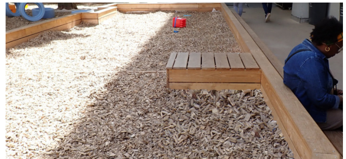
L'espace a été décloisonné, l'horizon s'est ouvert, les enfants peuvent circuler librement en fonction de leurs envies