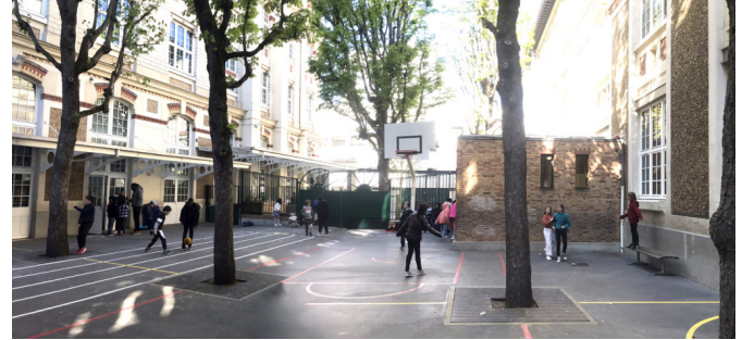
La cour avant travaux - espace élémentaire