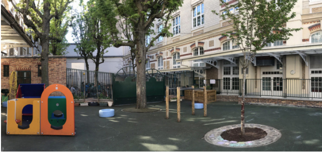
La cour avant travaux - espace maternelle | © CAUE de Paris