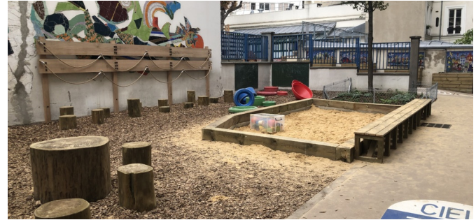
| © CAUE de Paris