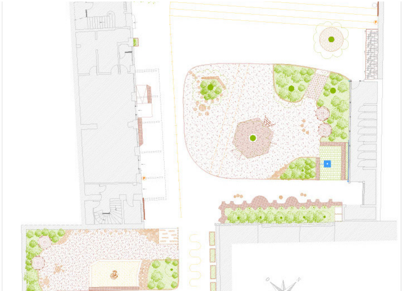
Plan de préconisations des parties basse et haute de la cour