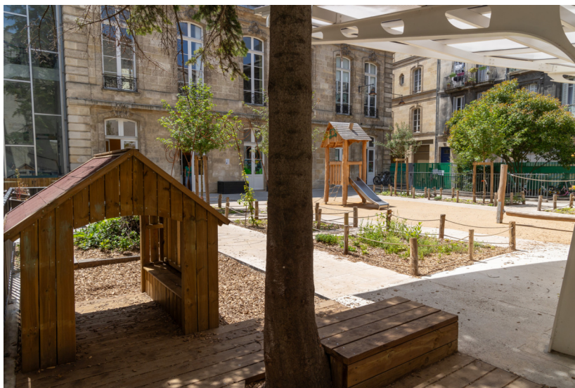
Vue de l'ensemble de la cour depuis le préau