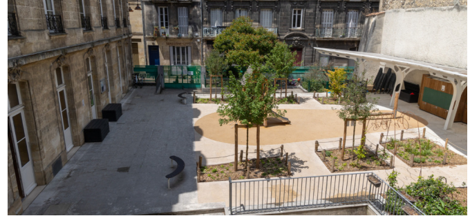
Vue depuis l'école