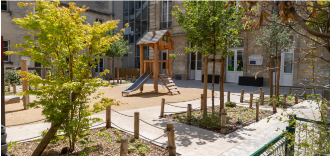
Vue sur les massifs végétalisés protégés par des potelets et cordes, le temps de la prise des végétaux