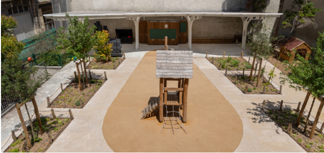
Vue depuis l'école