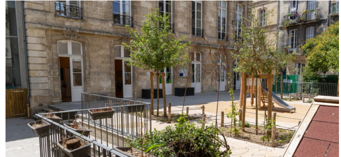
Vue d'une structure pour plantes grimpantes