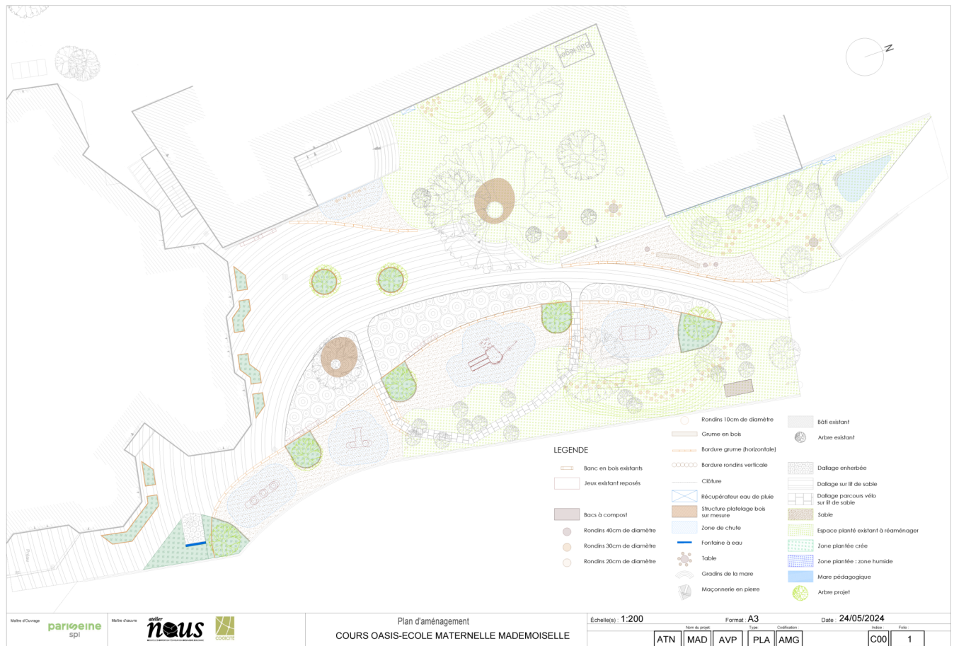
Plan d'aménagement | © Atelier NOUS / Cogicité