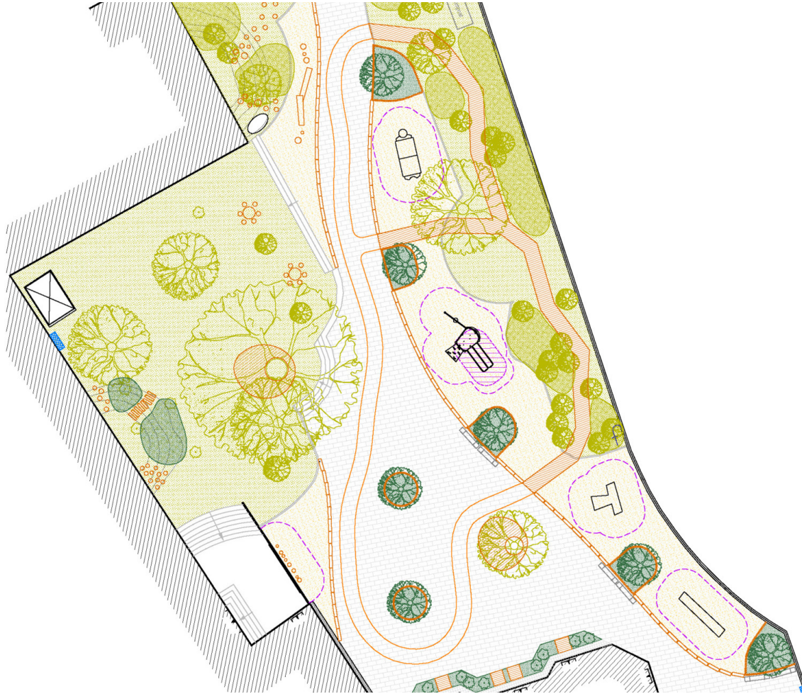
Plan des préconisations