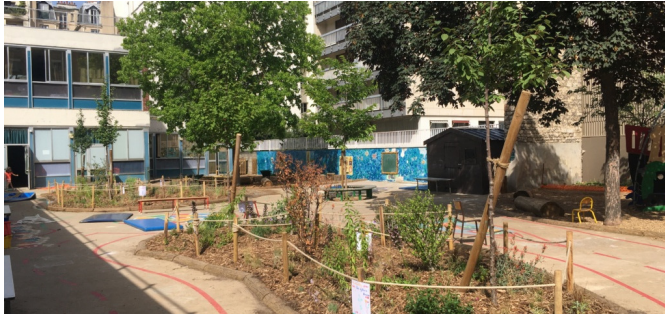
Îlots végétalisés au centre de la cour