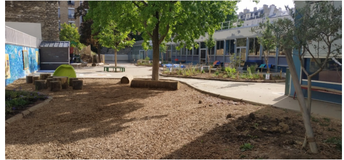
Zone calme