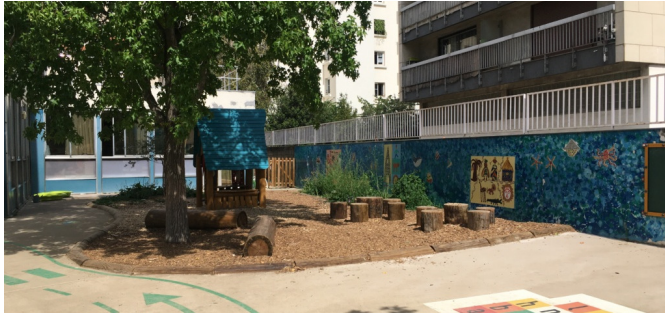
Zone calme | © CAUE de Paris