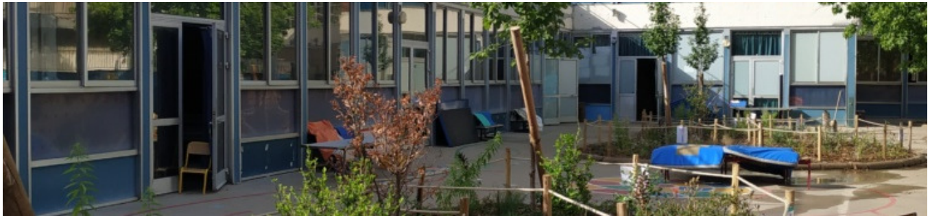
Îlots végétalisés au centre de la cour