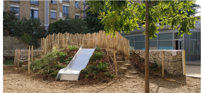
Butte végétalisée