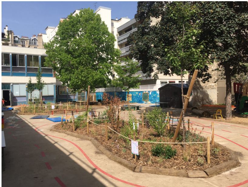
École maternelle Lacordaire

École maternelle 15e arrondissement 2021