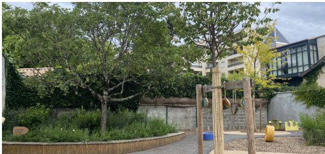
Vue des différents revêtements de sol