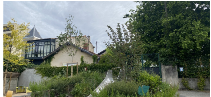
Butte plantée avec toboggan