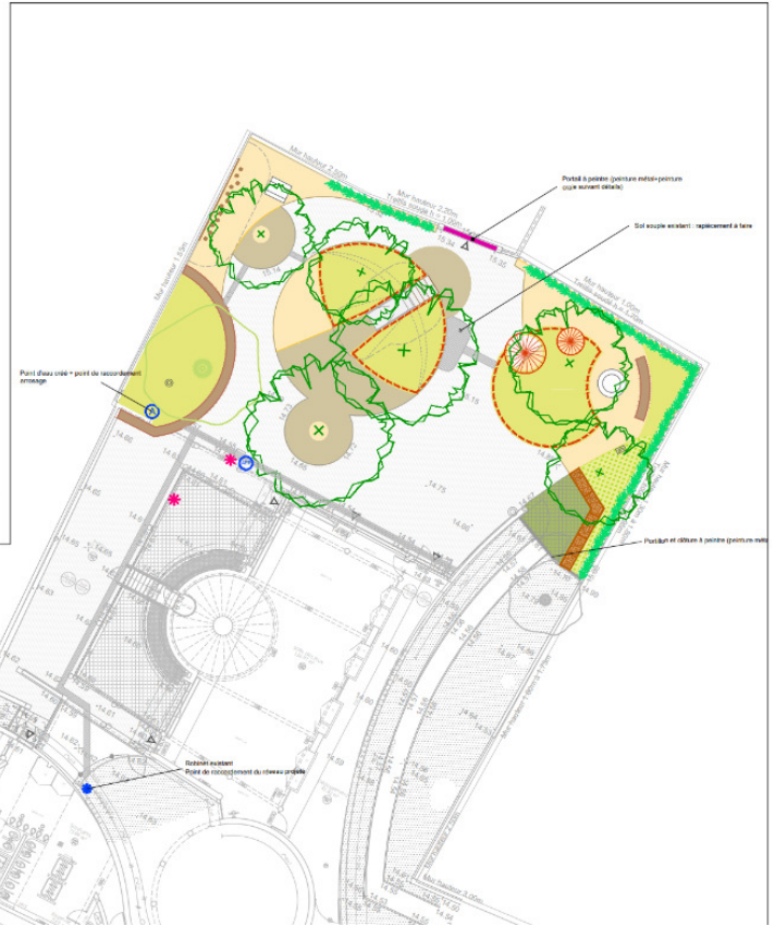
Plan masse du projet | © Maîtrise d'oeuvre LS2 (groupeement LS2, Verdi, Equal Saree, Topager, Playgones)