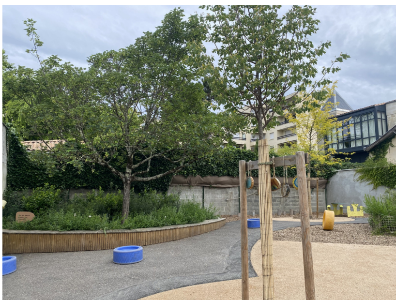
Vue de la cour - mai 2024