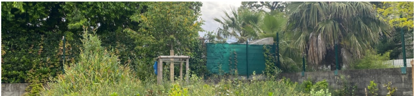
Plantations et clôtures