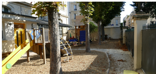
Vue vers la zone ludique et la zone calme au fond