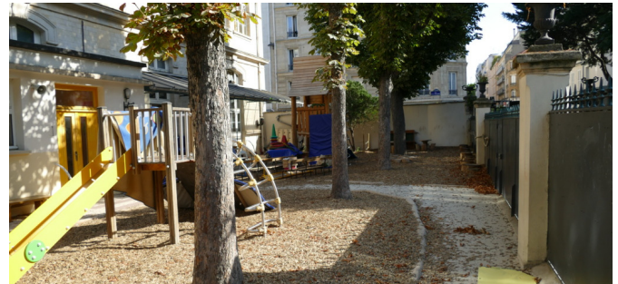
Vue vers la zone ludique et la zone calme au fond