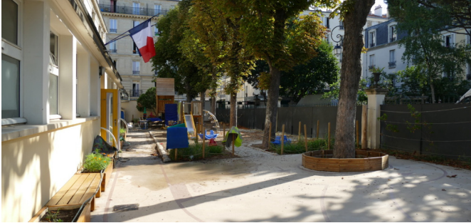
Vue d'ensemble depuis le jardin