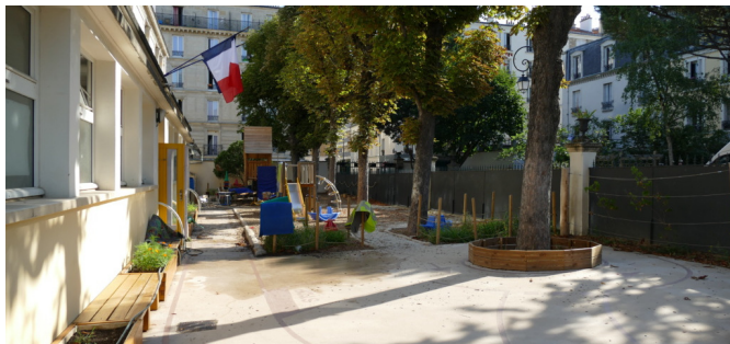
Vue d'ensemble depuis le jardin