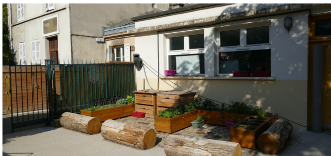
Jardin pédagogique