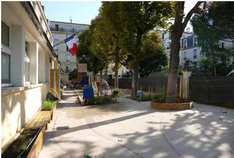
Vue d'ensemble

École maternelle 17e arrondissement 2021