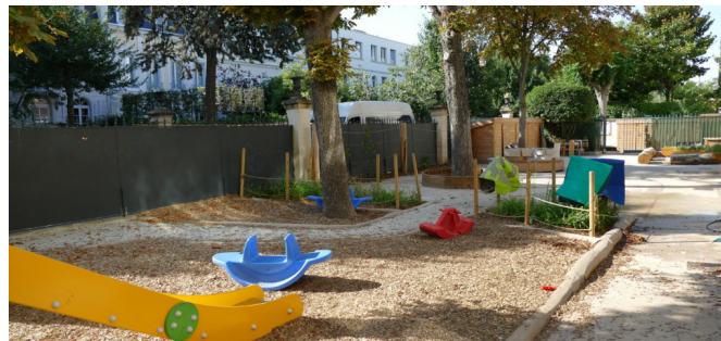
Vue vers l'entrée