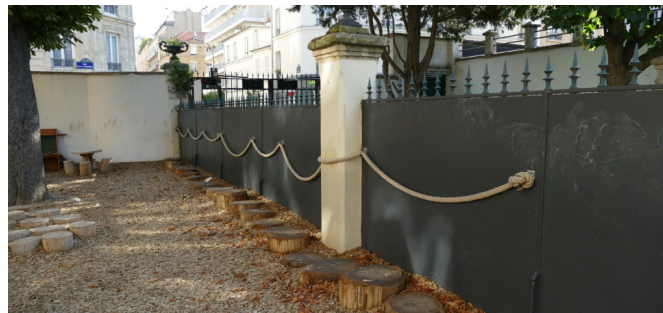
Via ferrata le long de la clôture