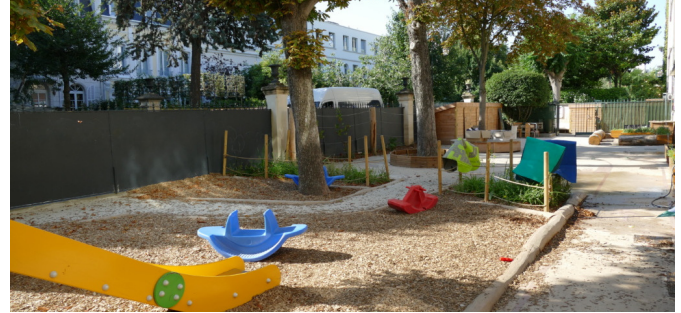
Vue vers l'entrée