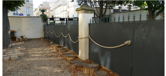
Via ferrata le long de la clôture