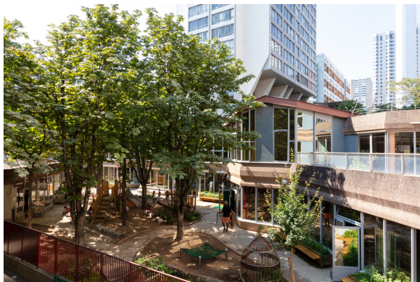
Ecole Emeriau

École maternelle 15e arrondissement 2020