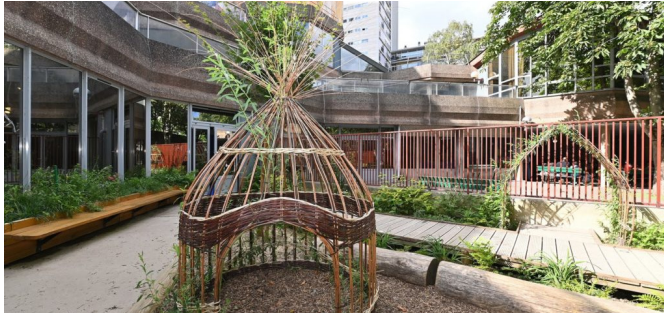
| © CAUE de Paris