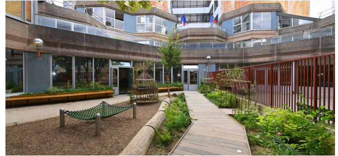
| © CAUE de Paris