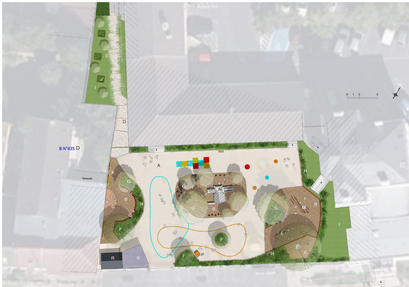
Plan AVP de la nouvelle cour