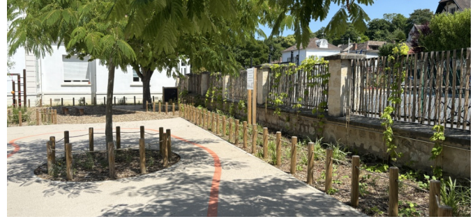
Lisière végétale