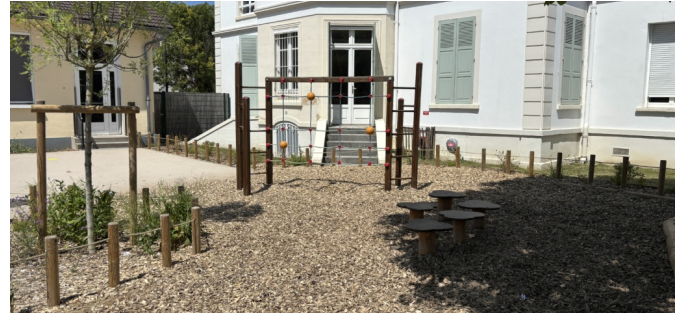
Structure de jeux