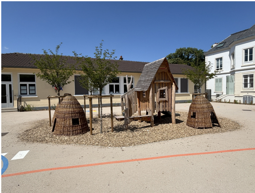
Ilôt central