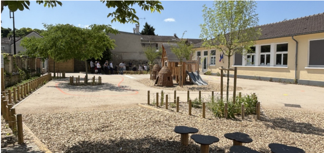
Vue d'ensemble de la cour