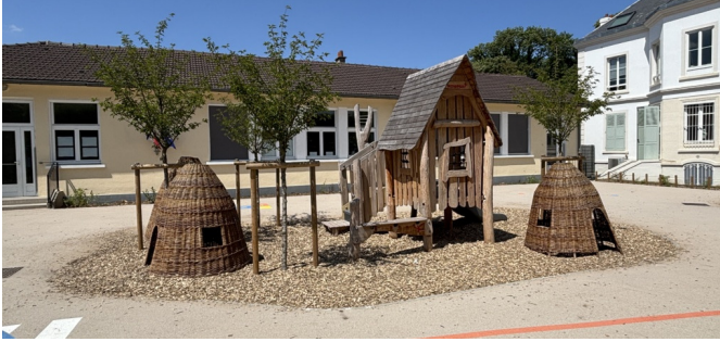
Ilot central avec structures de jeux et cabanes