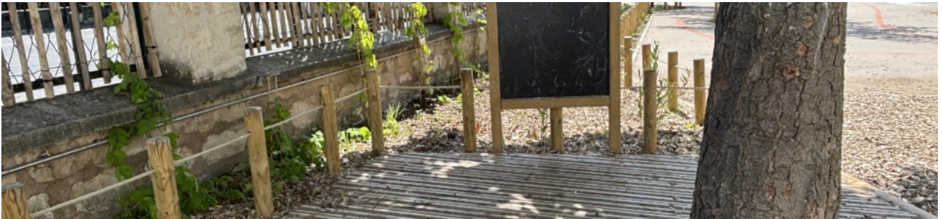
Coin ombragée et calme