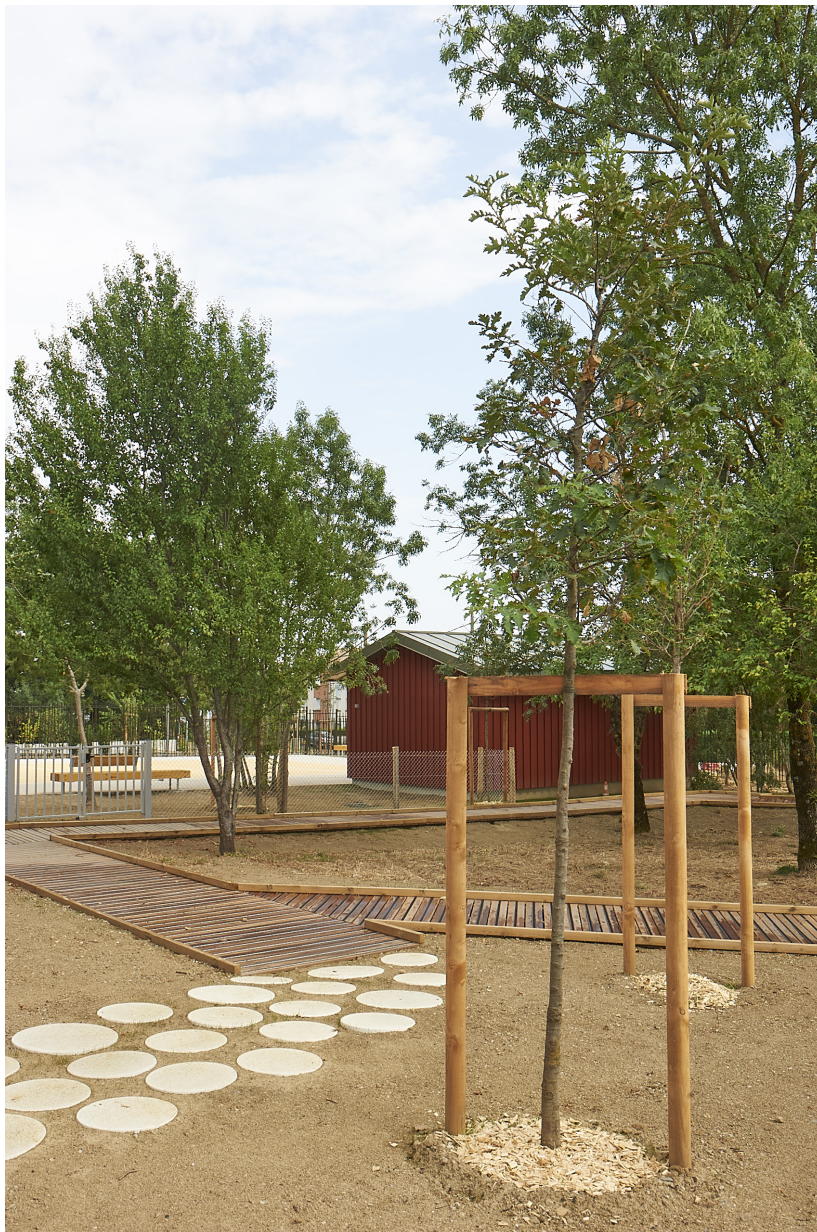
Le petit bois