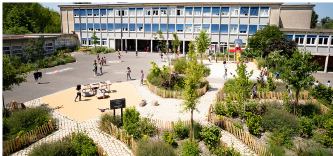
Cour du haut