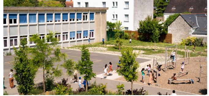
Cour du bas