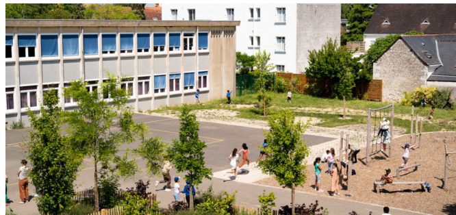
Cour du bas