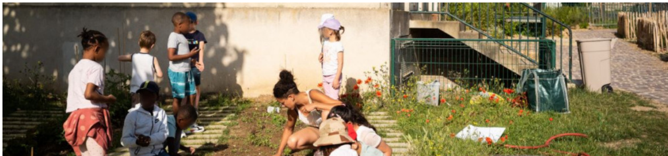
Le potager pédagogique