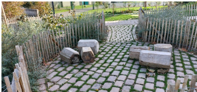
Alcôve avec assises en bois "fait maison" déplaçables