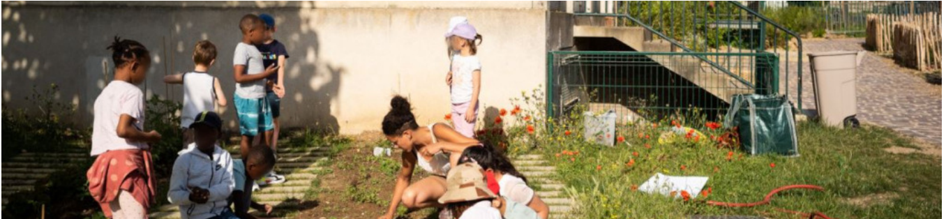
Le potager pédagogique