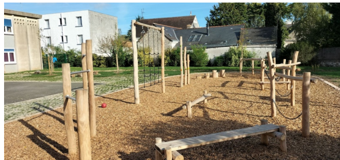
Parcours d'équilibre en bois