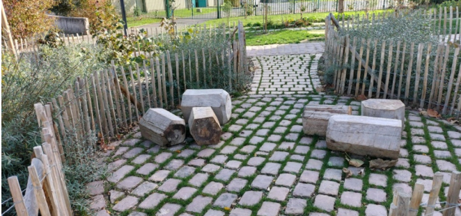
Alcôve avec assises en bois "fait maison" déplaçables