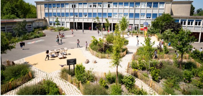
Cour du haut