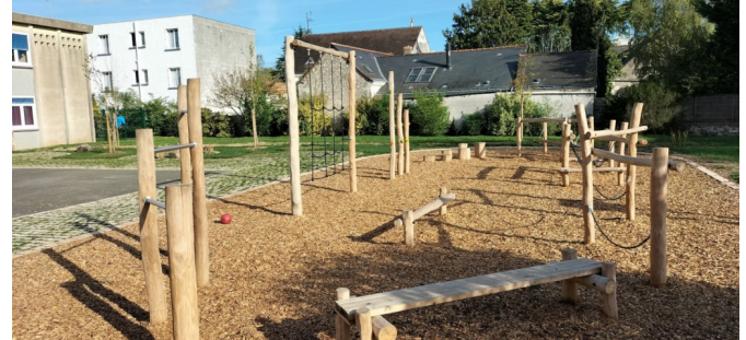
Parcours d'équilibre en bois