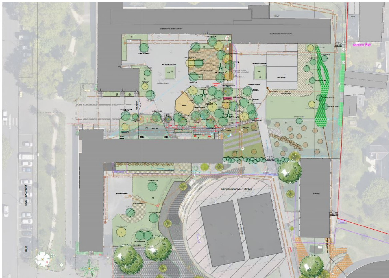
Plan de plantation de l'école Saint-Exupéry