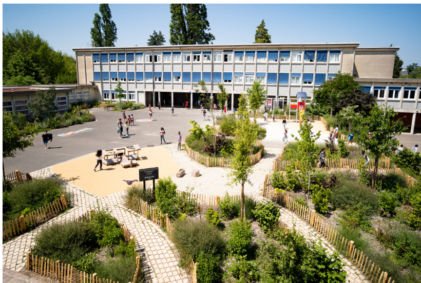
Cour de l'école élémentaire Saint-Exupéry