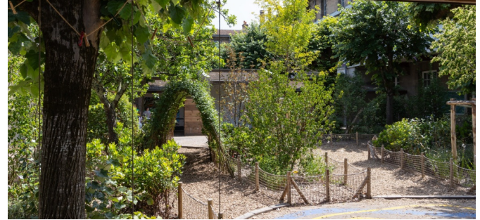
Cour calme