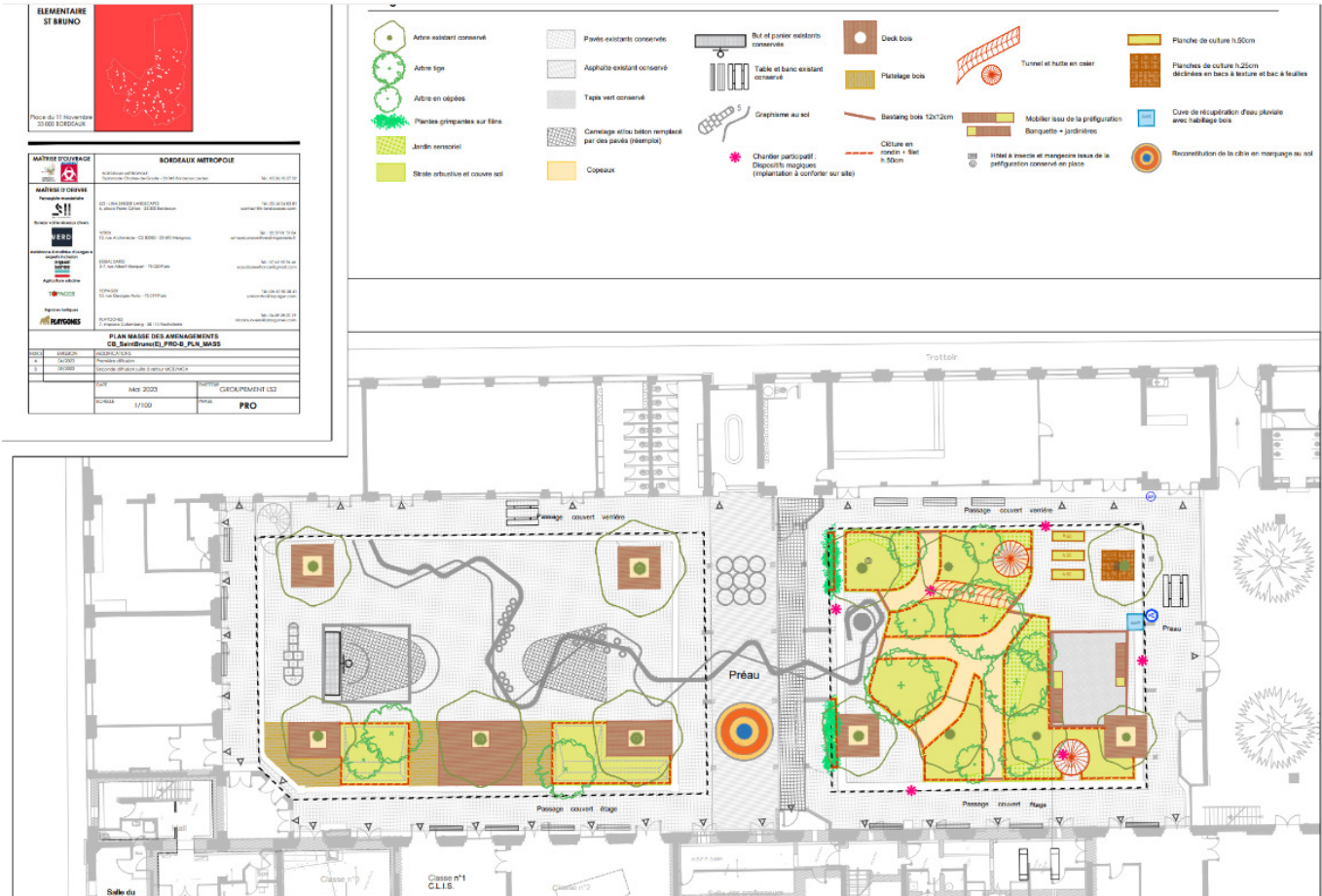
Plan masse | © Maîtrise d'œuvre LS2 (groupement LS2, Verdi, Equal Saree, Topager, Playgones)