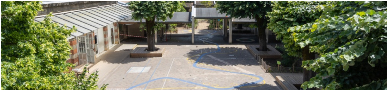
Cour active | © T. Sanson - Ville de Bordeaux