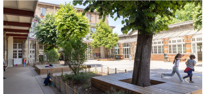
Terrasses en entourage d'arbre