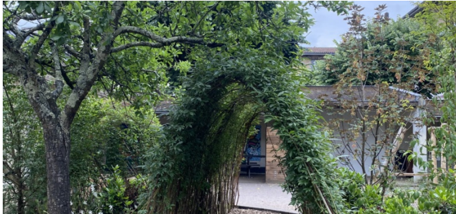
Tunnel végétal