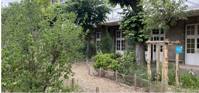
Cour calme