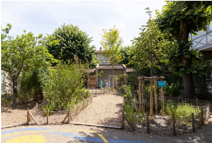
Cour calme - juin 2024