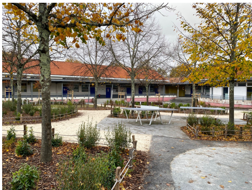
Vue d'ensemble de la cour - novembre 2023