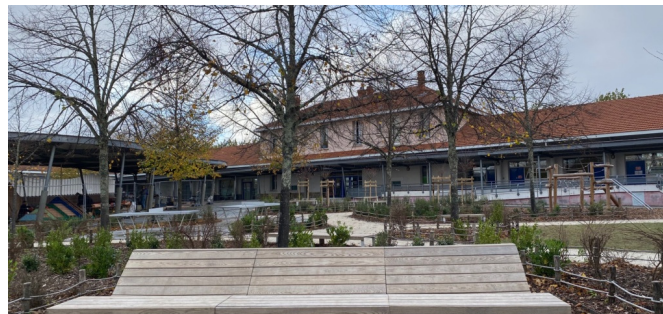
Divans en bois