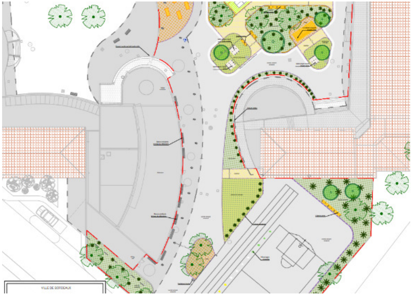
Plan masse du projet | © Maîtrise d'œuvre BASE (groupement BASE, SCE, Prélud)