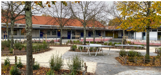
Plantations - novembre 2023