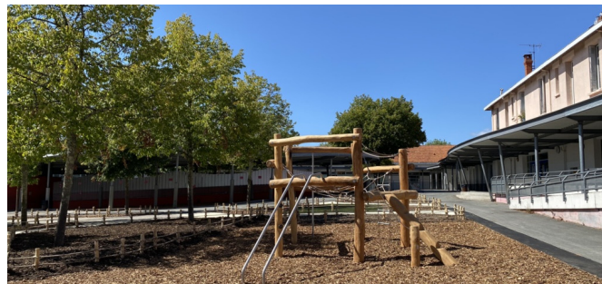
Zone de jeux