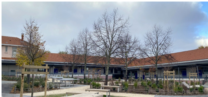
Vue d'ensemble | © Ville de Bordeaux