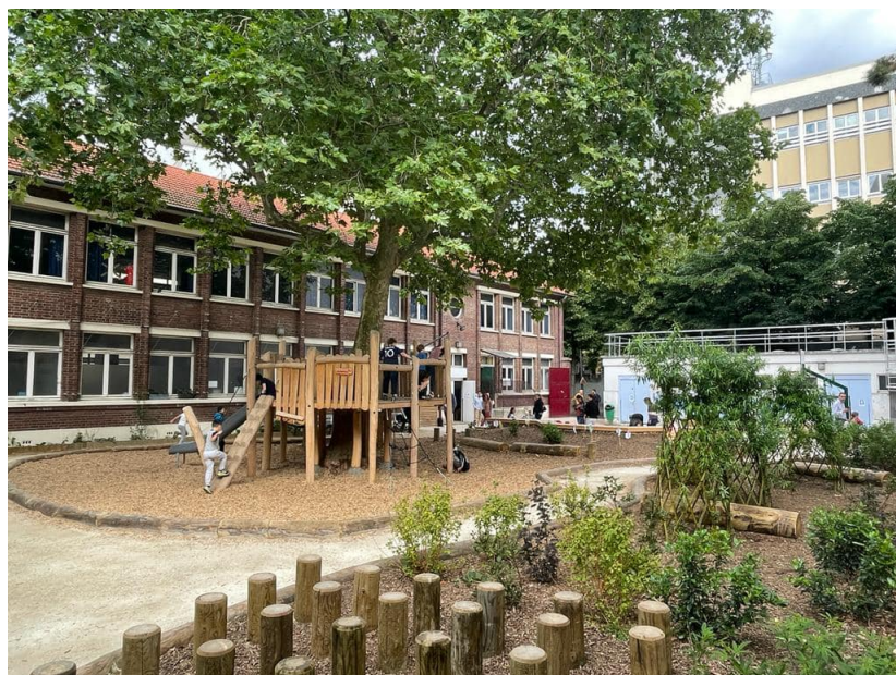
École élémentaire Providence

École élémentaire 13e arrondissement 2021