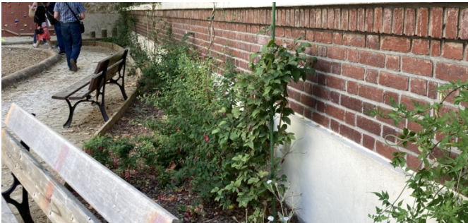
Plantes grimpantes sur la façade principale