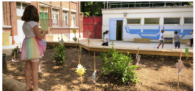
Vue depuis la zone ludique vers le terrain de sport, au premier plan la signalétique faite par les enfants