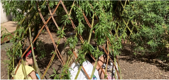
Cabane en osier vivant