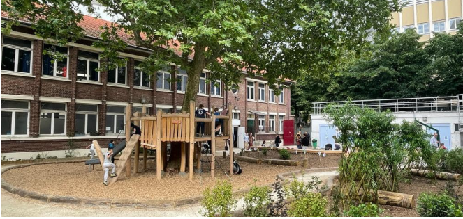
Vue d'ensemble de la cour depuis la zone calme