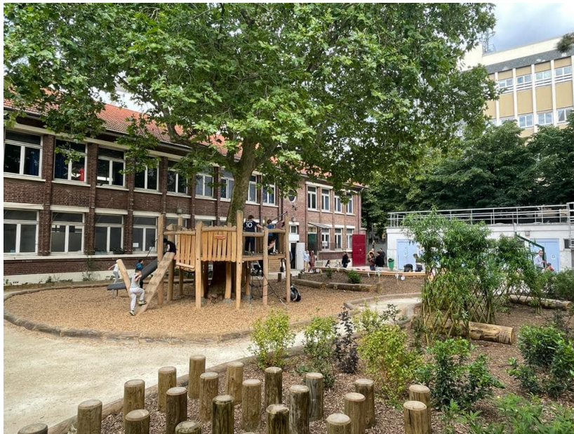
École élémentaire Providence

École élémentaire 13e arrondissement 2021