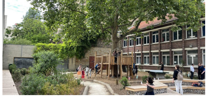
Vue d'ensemble de la cour depuis le terrain de sport