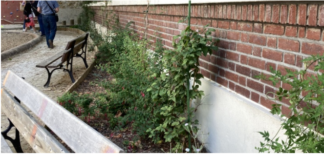
Plantes grimpantes sur la façade principale