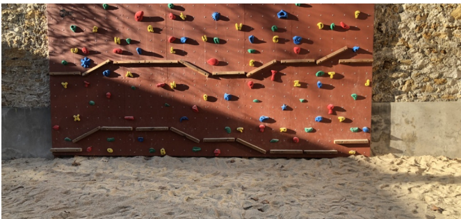
Mur d'escalade