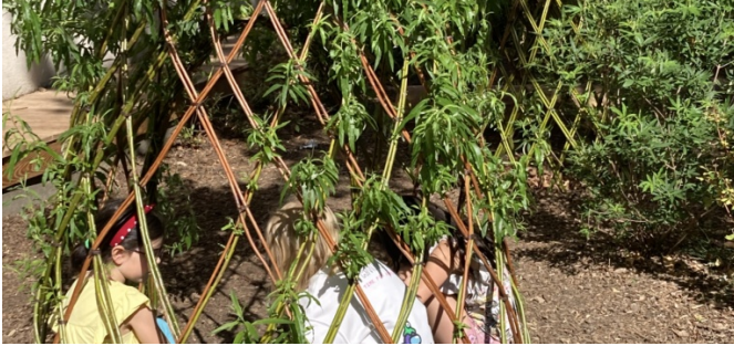
Cabane en osier vivant