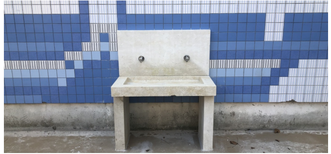
Fontaine murale