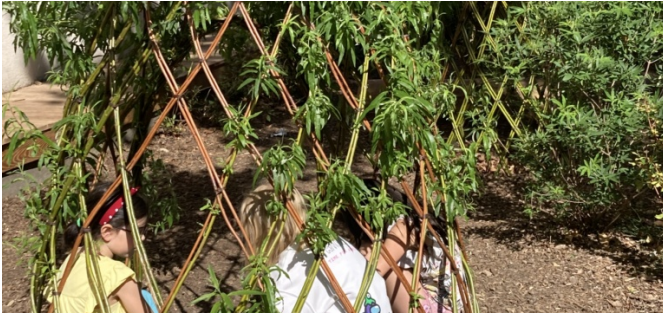
Cabane en osier vivant