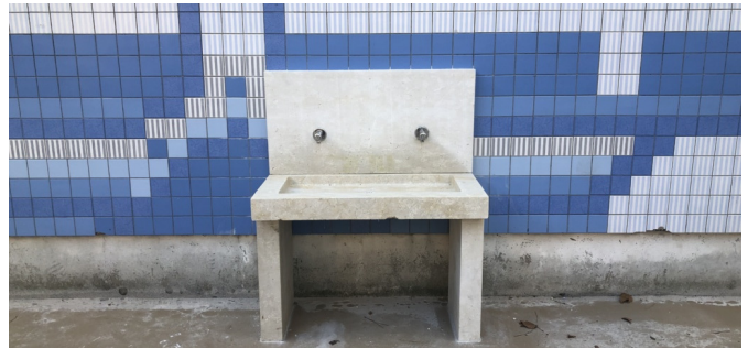
Fontaine murale