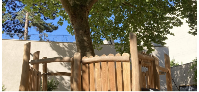
Structure de jeu autour du platane existant