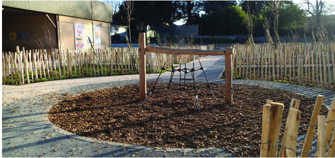
Jeux en bois brut non traité sur plaquettes forestières