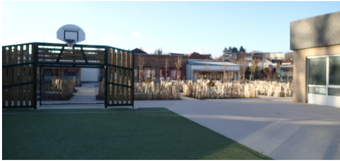
Terrain de jeux collectifs en gazon synthétique. Janvier 2024