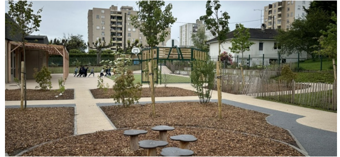
Aire de jeux. Mai 2024