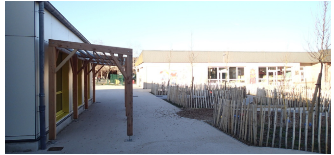
Pergola protégeant les façades les plus ensoleillées