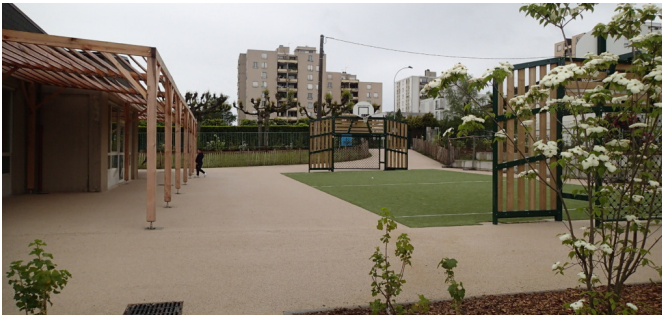
Bosquets, terrain de jeux collectifs et pergola. Mai 2024