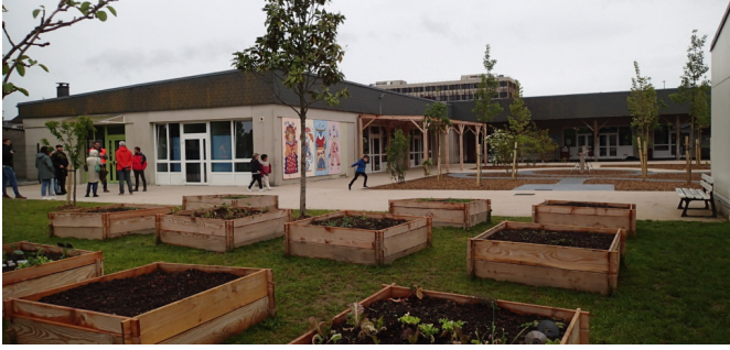
Carrés potagers