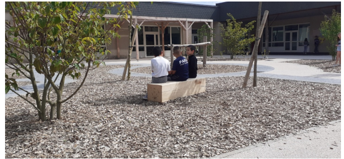
Banc réalisé avec les troncs des arbres abattus en début de chantier