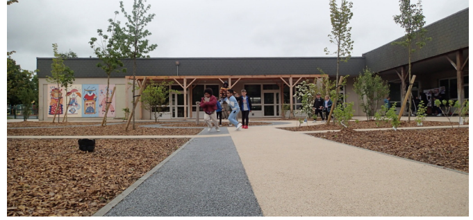
Revêtement perméable type Urbalith, pour la piste cyclable (teinte sombre) et les chemins (teinte claire)