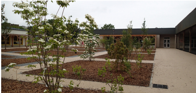
Bosquets au centre de la cour