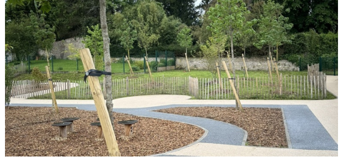
Bosquets et aire de jeux. Mai2024