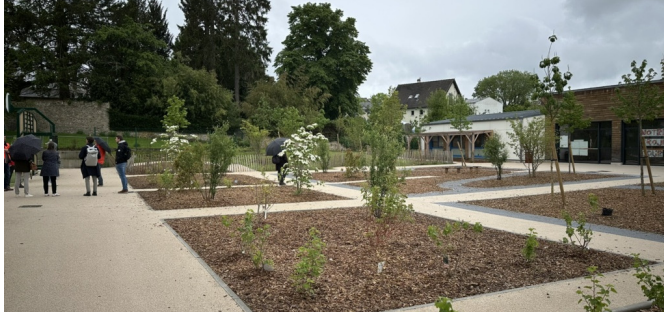
Bosquets et aire de jeux, quelques mois après la plantation des végétaux. Mai 2024 | © CAUE de la Creuse