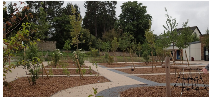
Bosquets, chemin et piste cyclable. Mai 2024