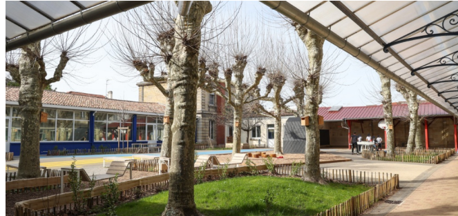
Vue d'ensemble de la cour