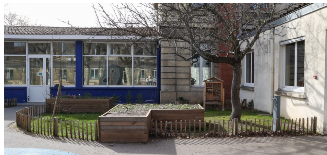
L'espace potager et l'hôtel à insecte