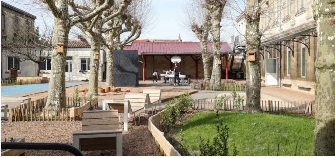
Vue de la cour et de la diversité de sols (mars 2023)