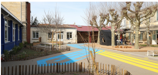
Le coin "pique-nique" et zones plantées | © Ville de Bordeaux (Thomas Sanson)