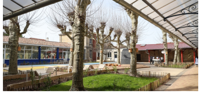
Vue d'ensemble de la cour