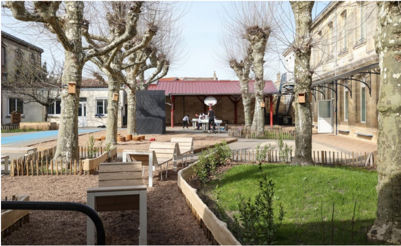
La cour et ses différents espaces (mars 2023).