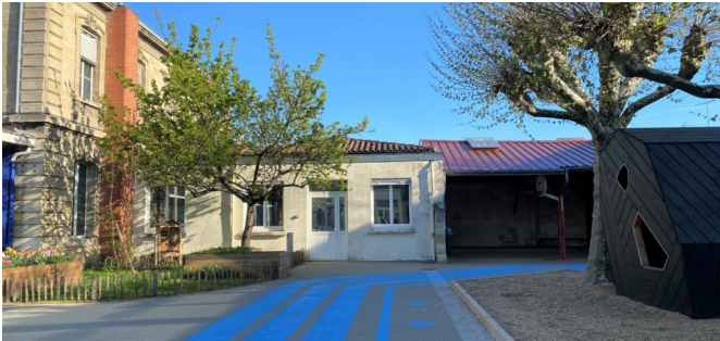
Différents éléments de la cour