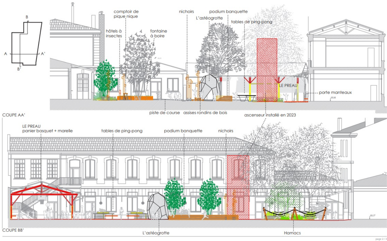
Coupes montrant les aménagements de la cour (phase AVP) | © Maîtrise d'œuvre BASE + SCE + PRELUD