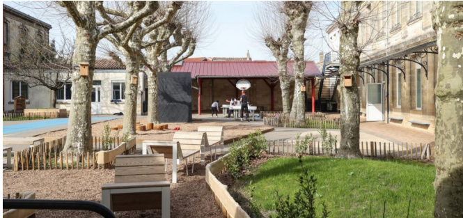
Vue de la cour et de la diversité de sols (mars 2023)