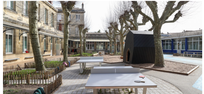
Des activités plus mixtes