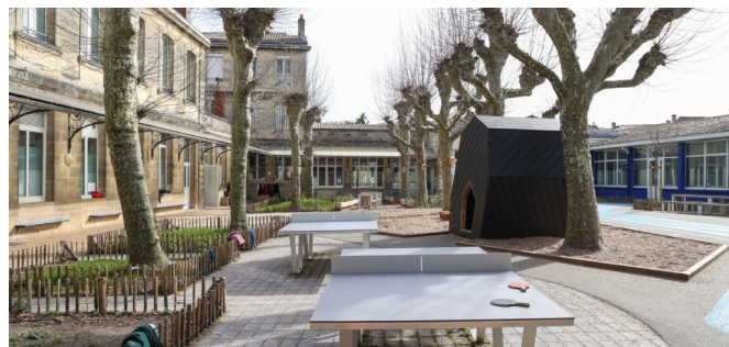
Des activités plus mixtes