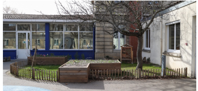
L'espace potager et l'hôtel à insecte