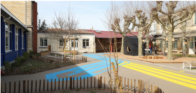
Le coin "pique-nique" et zones plantées