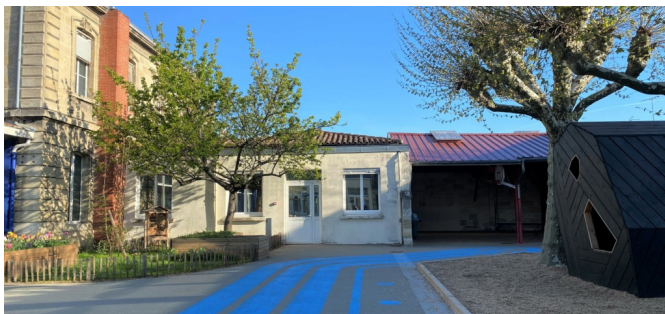
Différents éléments de la cour