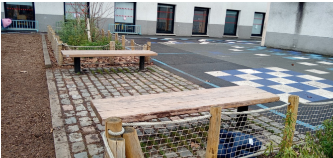
Banquettes sur pavés de réemploi et joints enherbés