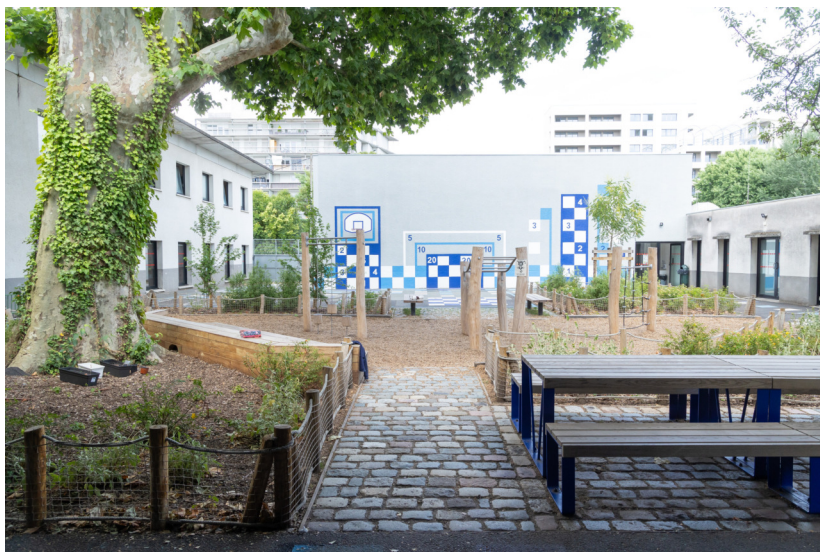
Vue de la cour principale