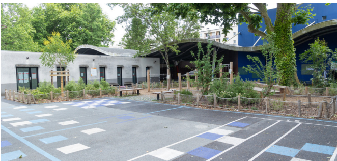
Vue d'ensemble