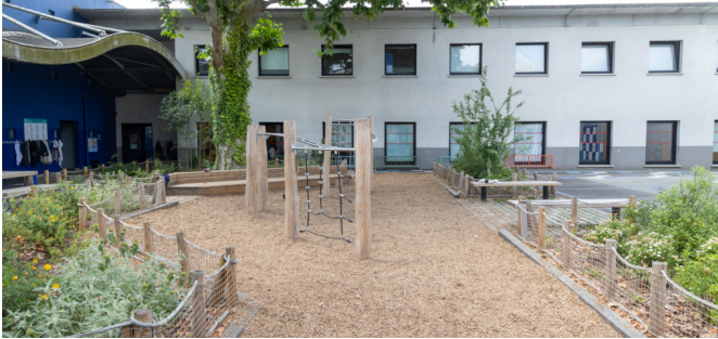
Vue sur la structure de jeux