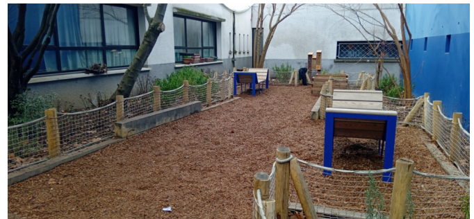
2ème cour pour activités calmes : lire, jardiner, observer les insectes, se reposer