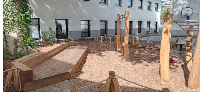
Vue sur l'estrade en bois, pour s'asseoir et faire l'école dehors