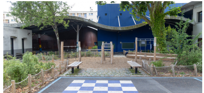
Vue sur l'aire de jeux