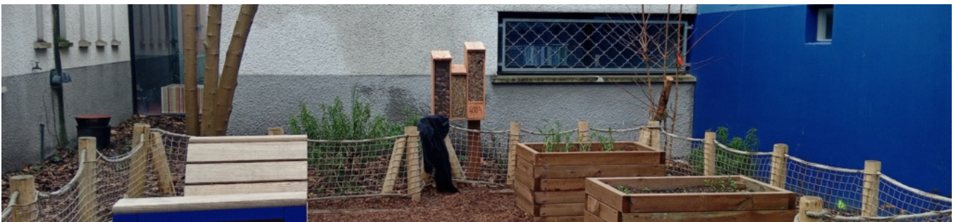
2ème cour pour être au calme | © Ville de Bordeaux