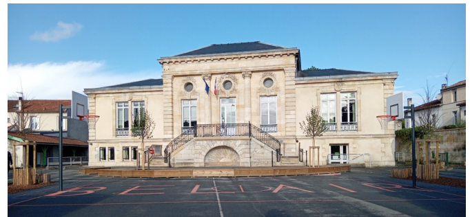
Vue de la cour depuis l'entrée | © Ville de Bordeaux