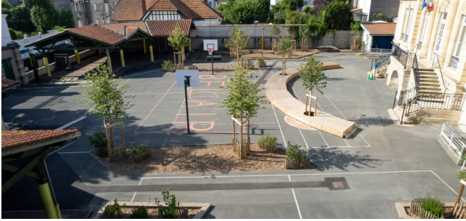
Vue sur l'ensemble de la cour