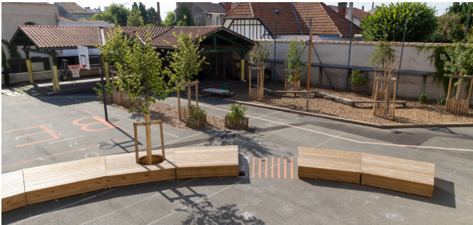
Vue droite depuis le perron de l'école