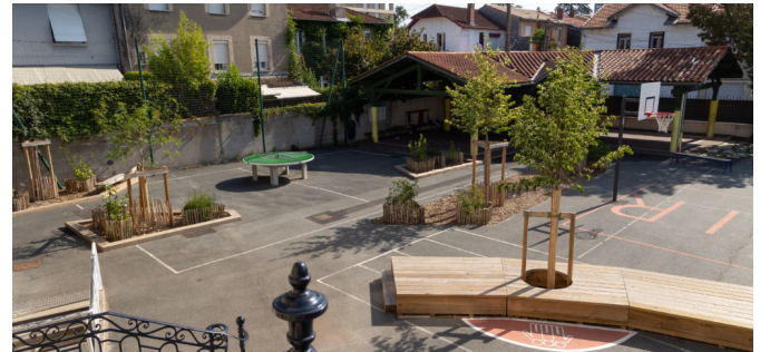
Vue gauche depuis le perron de l'école