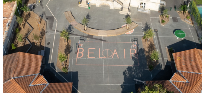
Vue du ciel