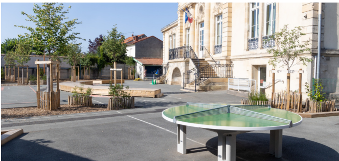
Table de ping-pong circulaire