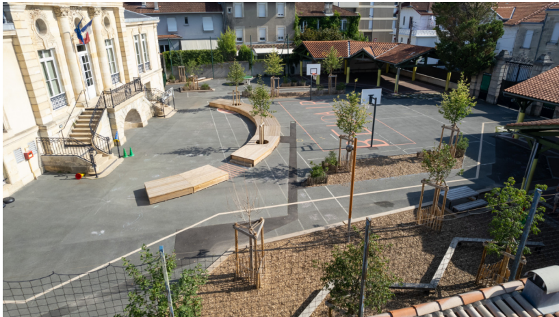
Vue d'ensemble de la cour