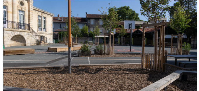
Espace en copeaux et banc en zig-zag