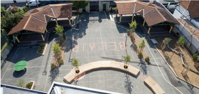
Vue du Ciel