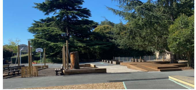
Vue d'ensemble de la cour avant plantations (octobre 2023)