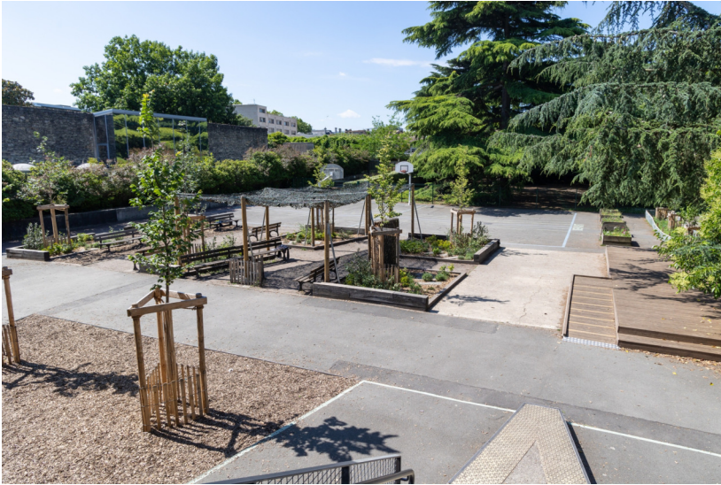
Vue d'ensemble de la cour - juin 2024