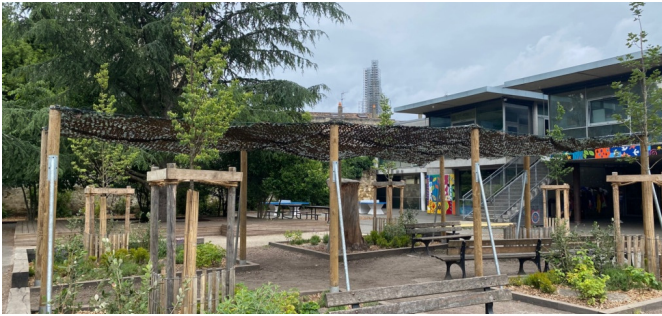
Massifs avec vivaces et arbres, et ombrière (mars 2024)