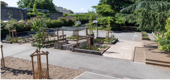
Vue d'ensemble de la cour