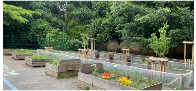
Bacs potagers et verger (mai 2024)