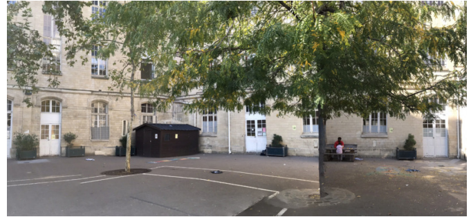
Cour existante