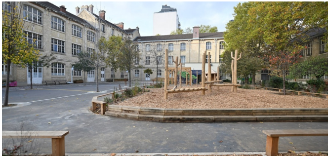
La nouvelle zone ludique avec la structure de grimpe et parcours