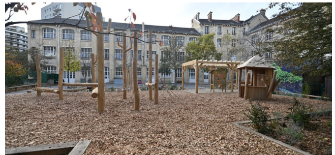
Cabane et grande pergola créent de nouveaux espaces de jeux