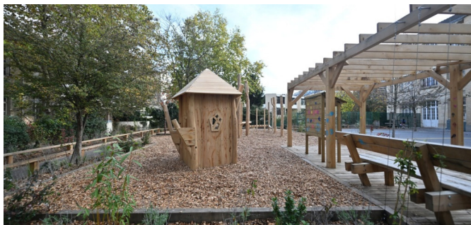
Des plantations bordent la zone en copeaux pour éviter leur dispersion