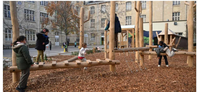
La nouvelle zone ludique avec la structure de grimpe et parcours