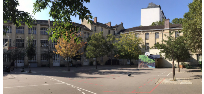
Cour existante | © CAUE de Paris