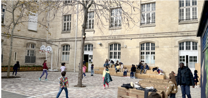
Espace calme avec gradins et jardin pédagogique