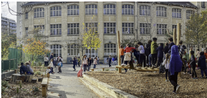
Un cheminement traverse l'espace de copeaux et permet un parcours autour de la cour pour la course ou le vélo | © CAUE de Paris