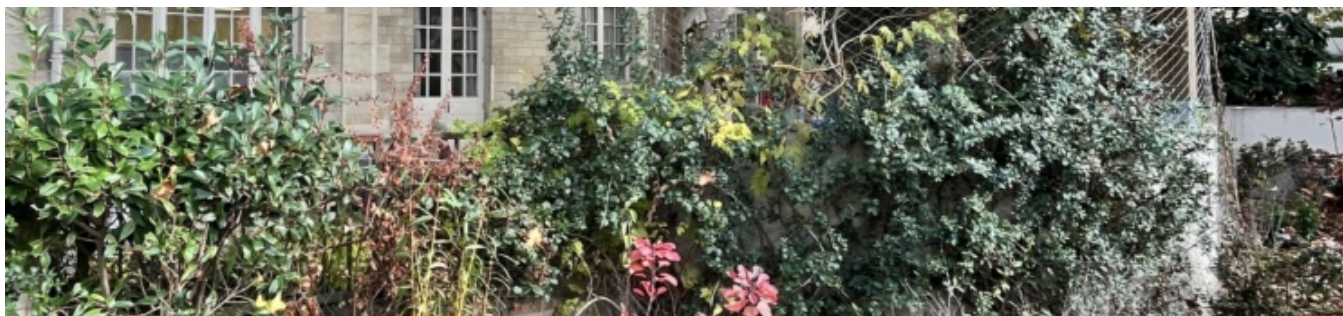
Les massifs plantés en limite de cour ont été élargis et densifiés en plantation pour diversifier les strates et la palette végétale.