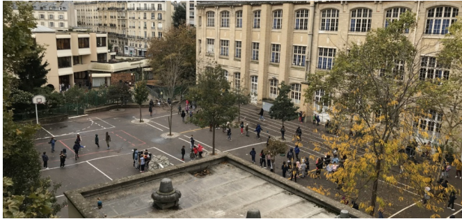
Cour existante