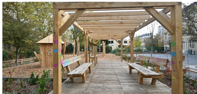
La pergola est un nouvel espace pour faire des activités ou la classe dehors. Une boîte à livre y est installée.