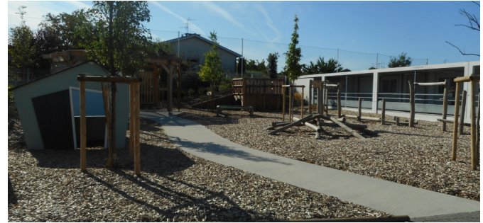
| © Ville de Toulouse