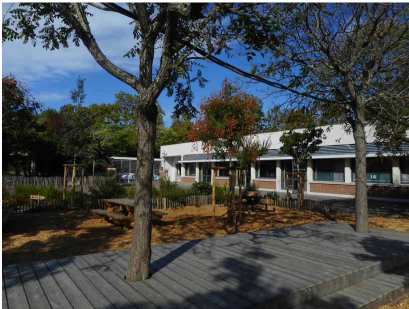
La zone de calme et de biodiversité au centre de la cour