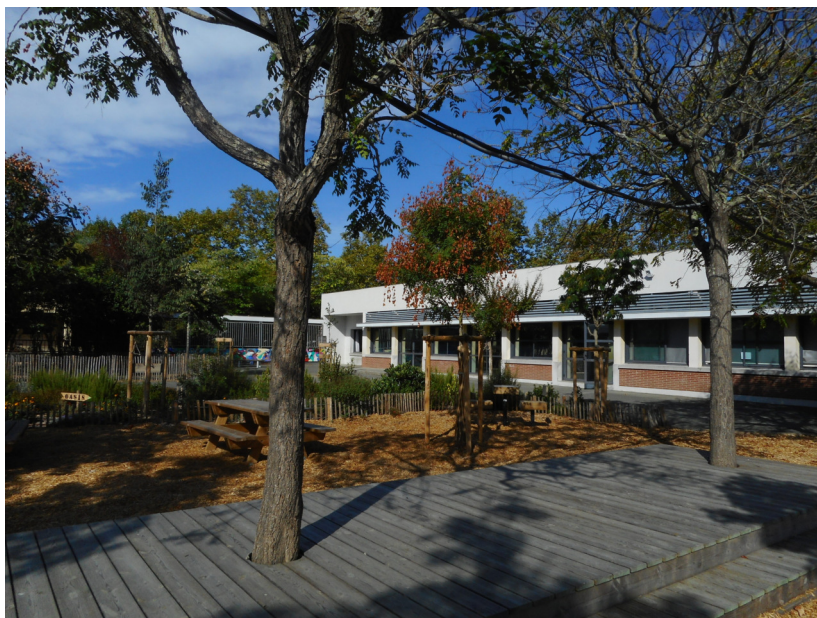
La zone de calme et de biodiversité au centre de la cour