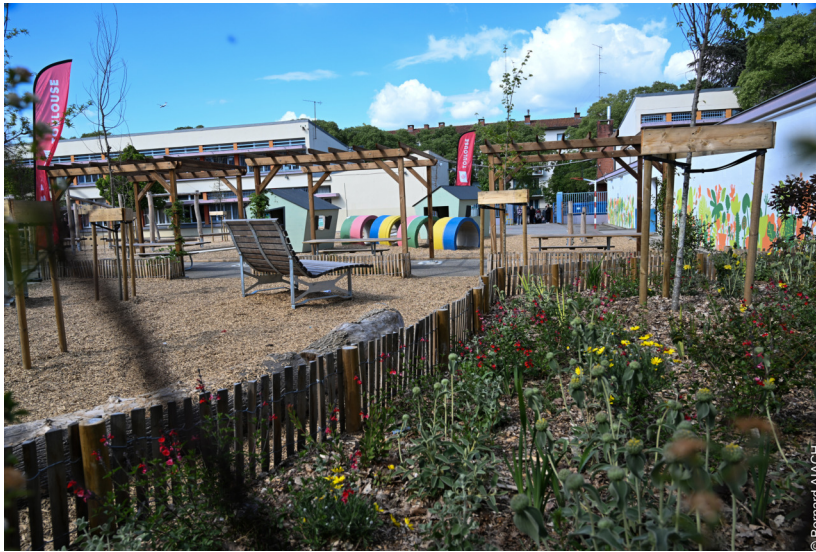
La zone ludique de la cour de l'école Papus