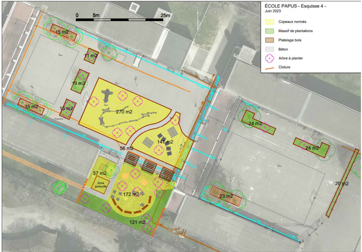
La projet de cour Oasis sur la cour de l'élémentaire Papus