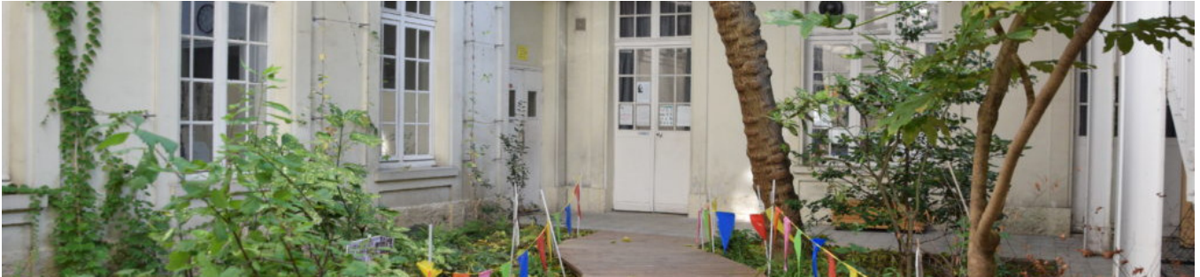
| © Vincent Guiné - CAUE de Paris