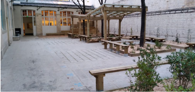
| © CAUE de Paris