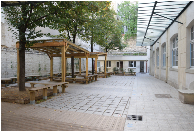
| © Vincent Guiné - Collège Gréard