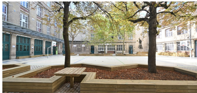
| © Laurent Bourgogne - Ville de Paris