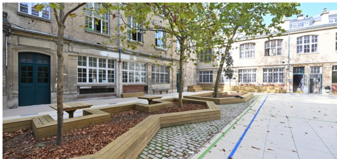
| © Laurent Bourgogne - Ville de Paris